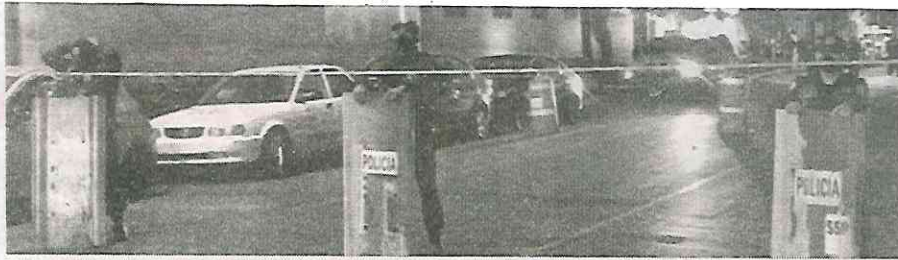
Gran movilización de la policía y bomberos