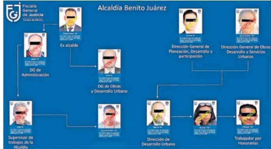
La Seduvi dio a conocer que en total se han detectado 130 inmuebles ligados al cártel inmobiliario de la alcaldía Benito Juárez y 264 niveles excedentes /FGJ CDMX