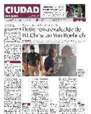
EL TAMBIÉN exdiputado del PAN, al momento de ser asegurado en Reynosa, Tamaulipas, ayer.