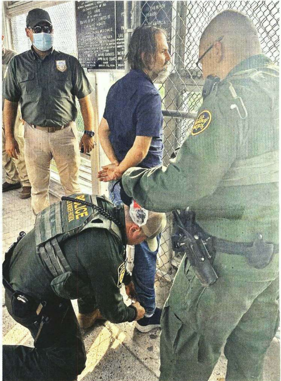
INTENTO FALLIDO. Tras ingresar ilegalmente a EU, el ex Delegado fue ubicado y detenido por la Patrulla Fronteriza.