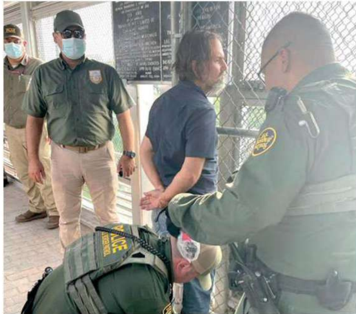
Fue puesto a resguardo