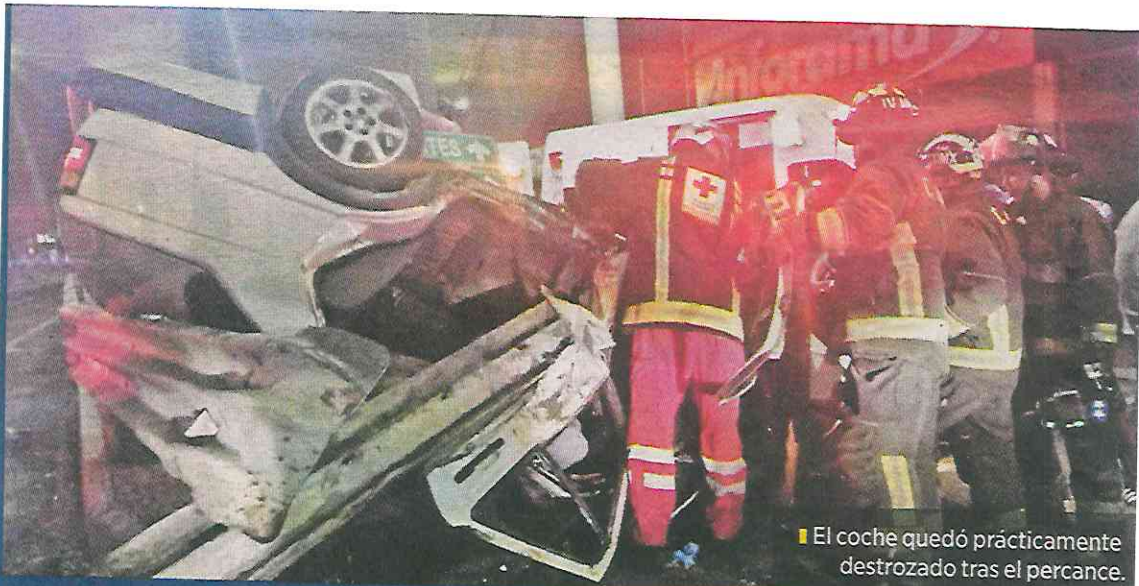
El coche quedó prácticamente destrozado tras el percance.

Al llegar al kilómetro 19, en la Colonia El Molinito, el conductor perdió el control y se fue directo contra una aguja vial que divide la salida hacia una parada de transporte público.