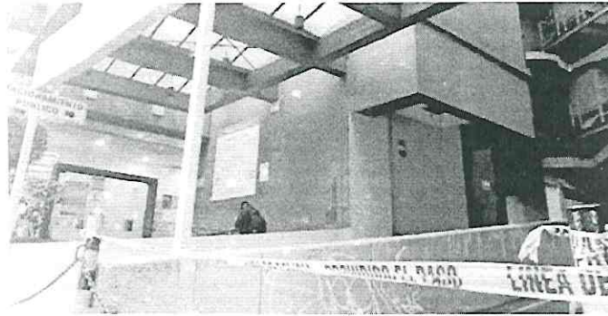
Aquí ocurrió el brutal crimen