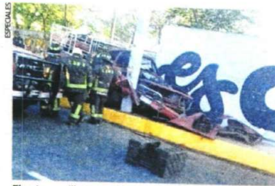
El automovilista murió a unos pasos de un cementerio.