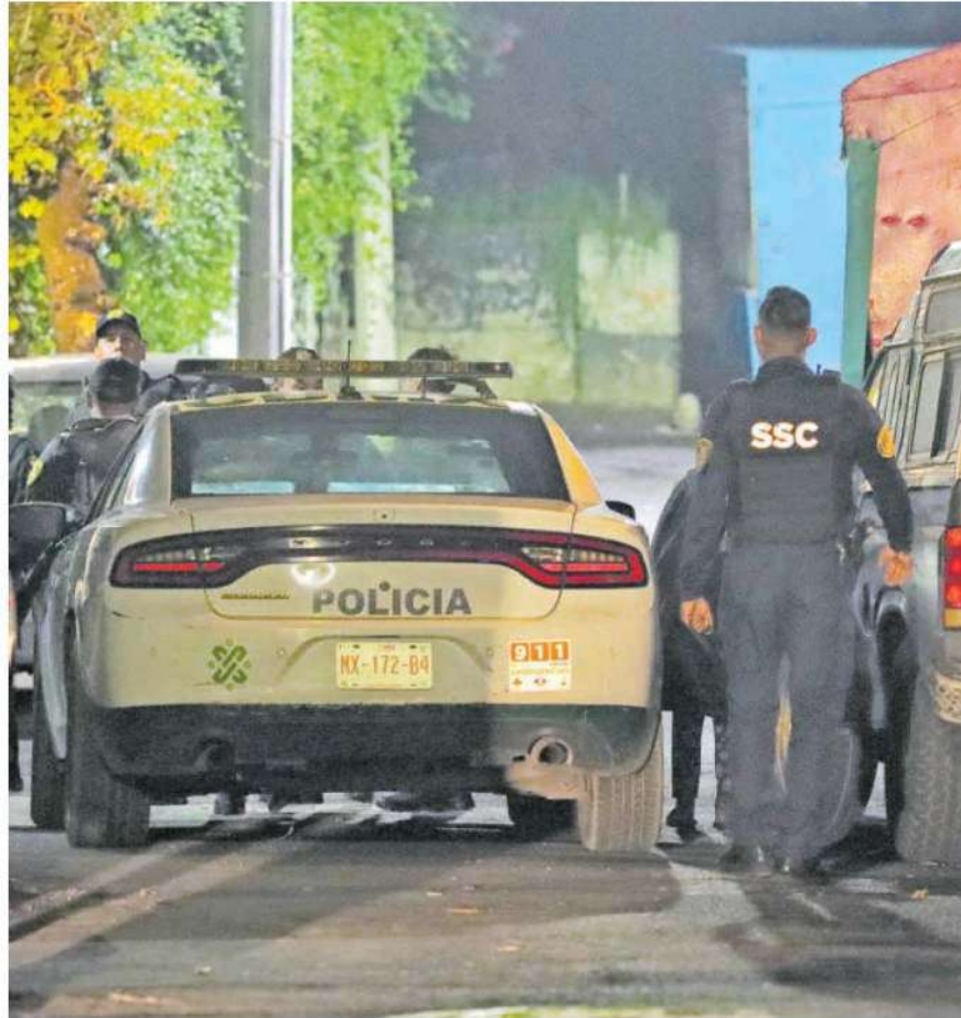
Los hechos ocurrieron en calles de la Colonia Pueblo Nuevo Alto en la alcaldía Magdalena Contreras /GUILLERMO PANTOJA