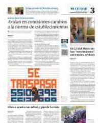
➤ Murió tras un percance en la alcaldía Xochimilco.