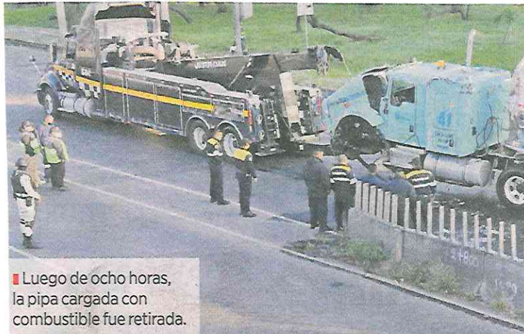
■ Luego de ocho horas, la pipa cargada con combustible fue retirada.