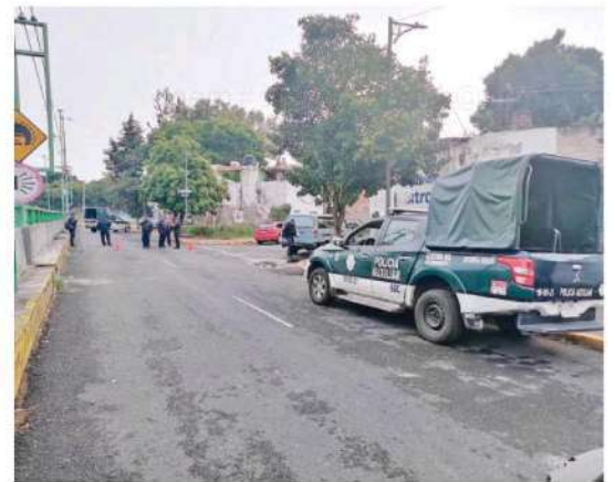
Elementos del ERUM acudieron a la llamada de emergencia y de igual manera llegaron policías y peritos