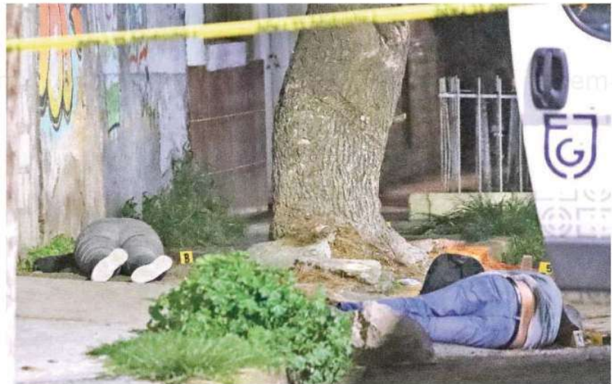
En calles de la Nueva Atzacolco quedaron los cuerpos de dos personas que fueron ultimadas a balazos

El sitio donde se encontraban los cadáveres de ambas personas de entre 25 y 35 años de edad quedó a resguardo de los uniformados.