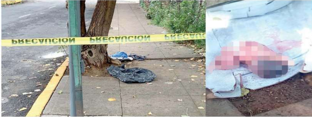
· El hecho provocó indignación entre vecinos