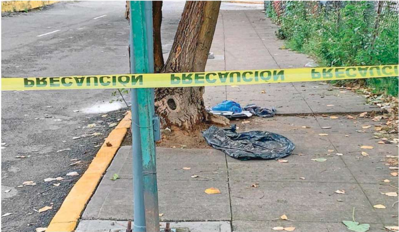
El cuerpo sin vida de un bebé recién nacido fue abandonado en calles de la Colonia Vallejo