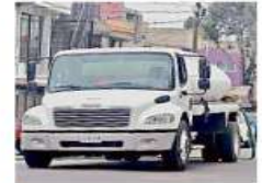
Profeco reveló que el agua de pipas cuesta 89% más.