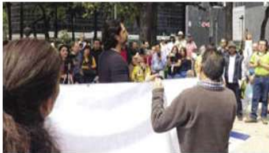
Durante la asamblea informativa.