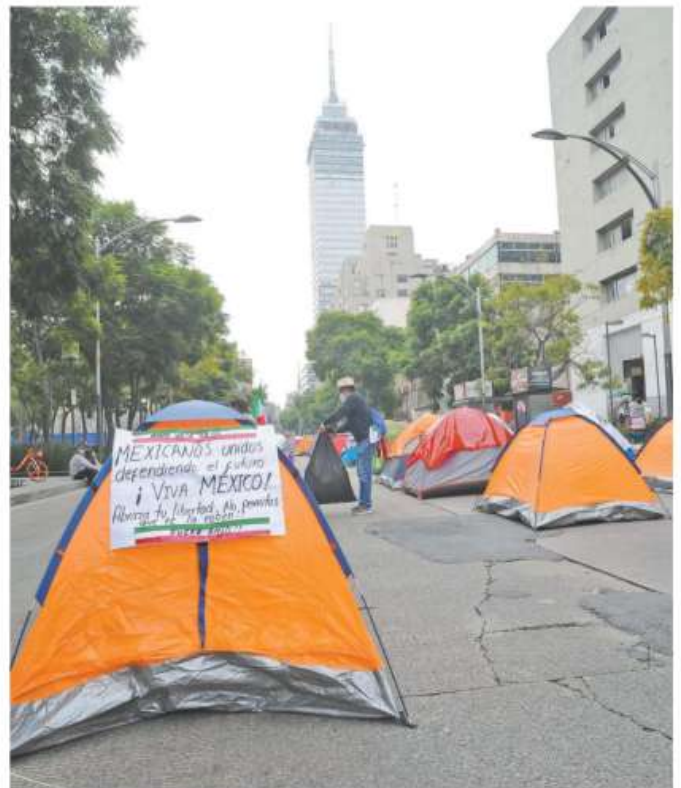
Plantón indefinido del grupo antiAMLO, cuya movilización comenzó el pasado sábado

Un amplio sector fue cerrado a la circulación vehicular, por lo que en Reforma ya no había paso desde el Eje 1 Norte hacia el poniente y desde Insurgentes hacia el oriente