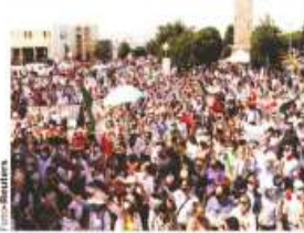
MANIFESTACIÓN de agricultores, ayer, en Delicias.