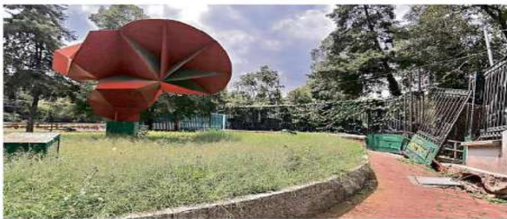
En esta área del Bosque de Chapultepec se tendrá un espacio para danza, teatro y ópera.

En el mismo sitio, durante la Administración de Miguel Ángel Mancera se intentó construir la Gran Rueda, como un mirador panorámico a la Ciudad, propuesta de una empresa, la cual fue rechazada.