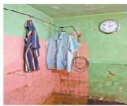
En las paredes de las casas se observa el nivel de la inundación.

agua alcanzó el metro de altura, mientras que en otras partes entre 42 y 72 centímetros; el líquido y lodo afectó los automóviles que estaban en un estacionamiento, refrigeradores, estufas, televisores, ropa y demás artículos del hogar de varias familias.