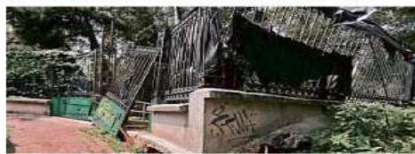
Los locales permanecieron en desuso por más de 15 años.

El plan incluía construir un paso peatonal elevado para conducir a los visitantes del bosque hacia el Metro, con paso por la plaza comercial, pero los comerciantes