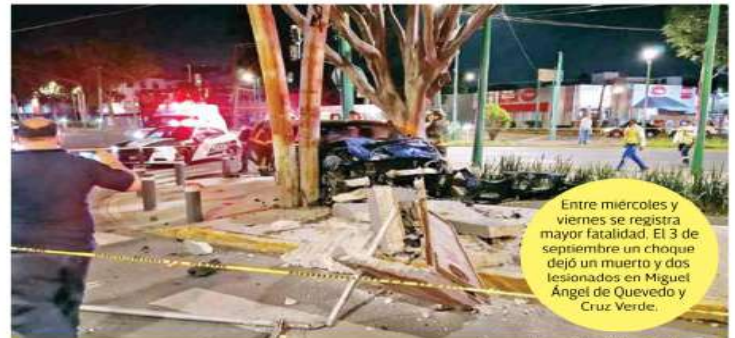
Entre miércoles y viernes se registra mayor fatalidad. El 3 de septiembre un choque dejó un muerto y dos lesionados en Miguel Ángel de Quevedo y Cruz Verde.

También recordó que el 23 de abril, como parte de la Fase 3 por la pandemia, el gobierno de la ciudad decretó el Hoy No Circula para todos los vehículos,