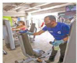
Los aparatos deberán ser limpiados constantemente.

El mobiliario y equipo deberá mantenerse a una distancia mínima de dos metros.