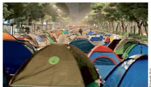
El plantón antiAMLO bajo la lluvia, en su segunda noche.

Un megaproyecto energético en Calpulalpan, Tlaxcala, pone en riesgo la riqueza ecológica y prehispánica del Monte de Malpais, señalan antropólogos y pobladores. CULTURA (PÁGINA 16)