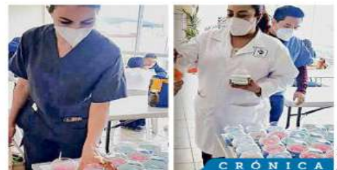
Los helados fueron repartidos al personal médico que estuvo en la primera línea de batalla del Covid.