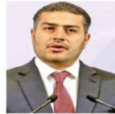
Omar García Harfuch, secretario de Seguridad Ciudadana.