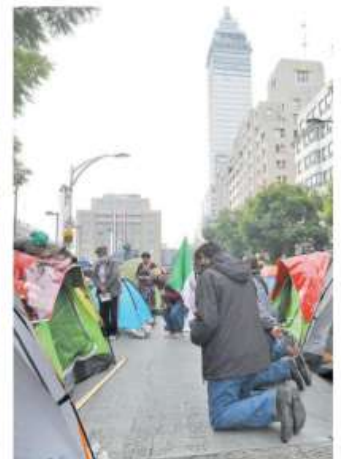
Llegaron para quedarse