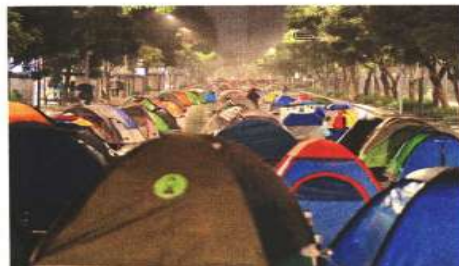
El plantón antiAMLO bajo la lluvia, en su segunda noche.

Un megaproyecto energético en Calpulalpan, Tlaxcala, pone en riesgo la riqueza ecológica y prehispánica del Monte de Malpais, señalan antropólogos y pobladores. CULTURA (PÁGINA 16)