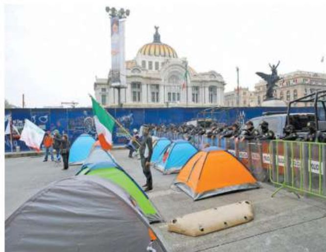
Acampen en un amplio sector de la zona, con el consecuente perjuicio para automovilistas y usuarios del Metrobús

El tiempo que va a durar este plantón no está definido, según dieron a La Prensa, al expresar que podría durar mucho tiempo, aunque, añadieron, se busca preservar la sana distancia, medidas de sanidad y por supuesto el uso de cubrebocas.