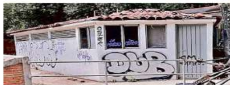
El objetivo era instalar a los comerciantes del Metro Auditorio.