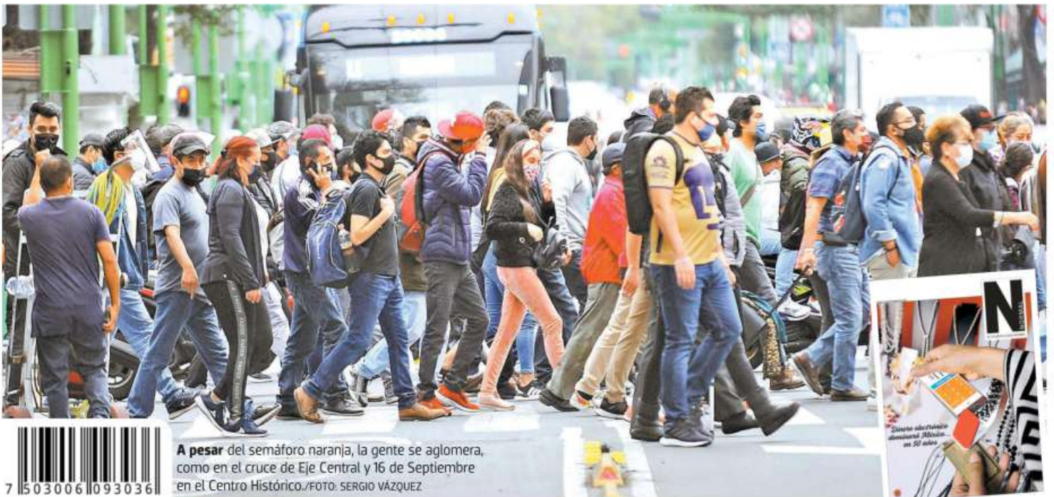
A pesar del semáforo naranja, la gente se aglomera, como en el cruce de Eje Central y 16 de Septiembre en el Centro Histórico.

TRAS SEIS MESES DEL PROTOCOLO SANITARIO Y A LA SOMBRA DE LOS 700 MIL CONTAGIOS Y LAS 74 MIL DEFUNCIONES, MÉXICO SALE DE CASA Pág. 4