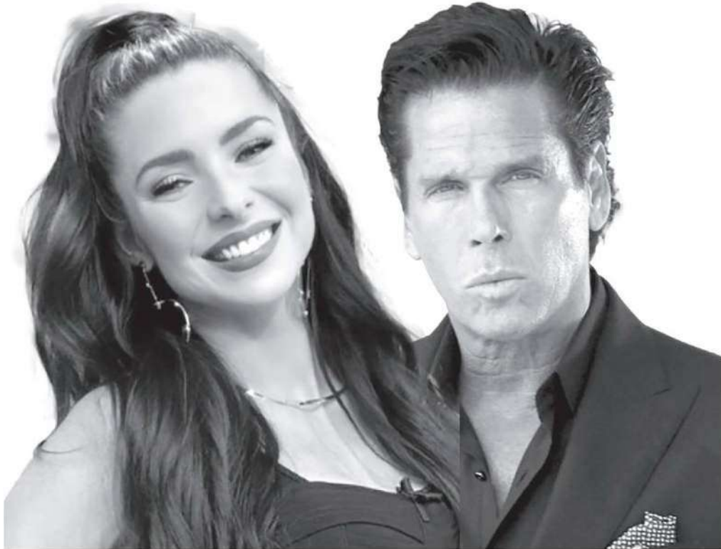
- Ariadne Díaz y Roberto Palazuelos, entre los timados