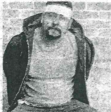
El hampón capturado

La FGJCD-MX informó que uno de los agentes heridos en la balacera se encuentra grave en el hospital.