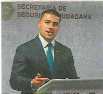
Omar Harfuch, jefe de la SSC