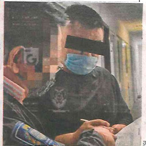
TRAIDOR. El Carmona es un policía de Investigación; fue suspendido de sus funciones.

El 6 de octubre, la Fiscalía de la CDMX informó que su Consejo de Honor y Justicia suspendió a este policía de Investigación, detenido por posibles delitos contra la salud y portación de arma de uso exclusivo de las Fuerzas Armadas. /24 HORAS