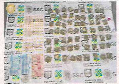
Gran surtido de estupefacentes traían en su poder cuando les cayó la ley

Por lo anterior, la joven de 24 años de edad, junto con los dos hombres de 52 y 43 años de edad, y lo decomi-