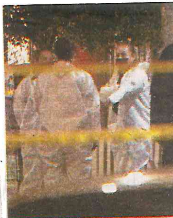
Se asesinaban a cuatro personas por día en la CDMX; actualmente la cifra ha bajado a dos.

tacar que las ordenes de aprehensión y vinculación ha presentado un aumento del 1.2% comparado con el año 2019. En el periodo de enero a septiembre 2021, se han realizado 143 remisiones y han sido 204 los detenidos por homicidios dolosos en la Ciudad de México, por lo que la Secretaría de Seguridad Ciudadana refiere que hoy en día el 100% de personas que son vinculadas a proceso por el delito de homicidio doloso cumplen su proceso de condena en prisión, eliminando la impunidad que se mostraba en periodos anteriores.