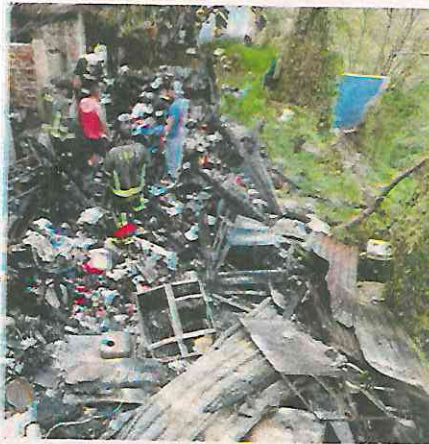
Tras el rescate policial, los bomberos controlaron el fuego

Los efectivos de la SSC están capacitados en materia de primeros auxilios y brindan apoyo a la ciudadanía en cualquier emergencia que pudiera poner en situación de riesgo o peligro a los habitantes de la capital.