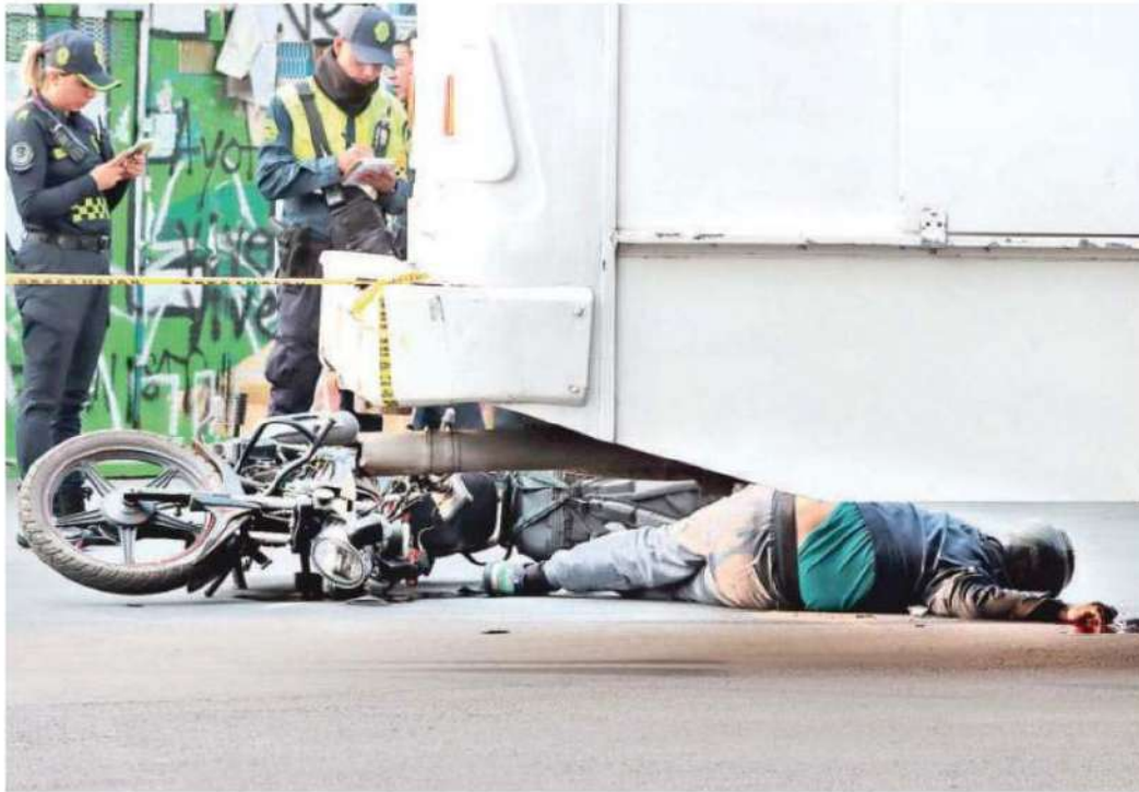
El accidente se registró la tarde de ayer cerca de las 16:30 horas en la Glorieta del Ahuehuate sobre Paseo de la Reforma, en la colonia Juárez