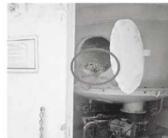
Quedó como pan de muerto

La Fiscalía capitalina investiga los hechos para deslindar responsabilidades