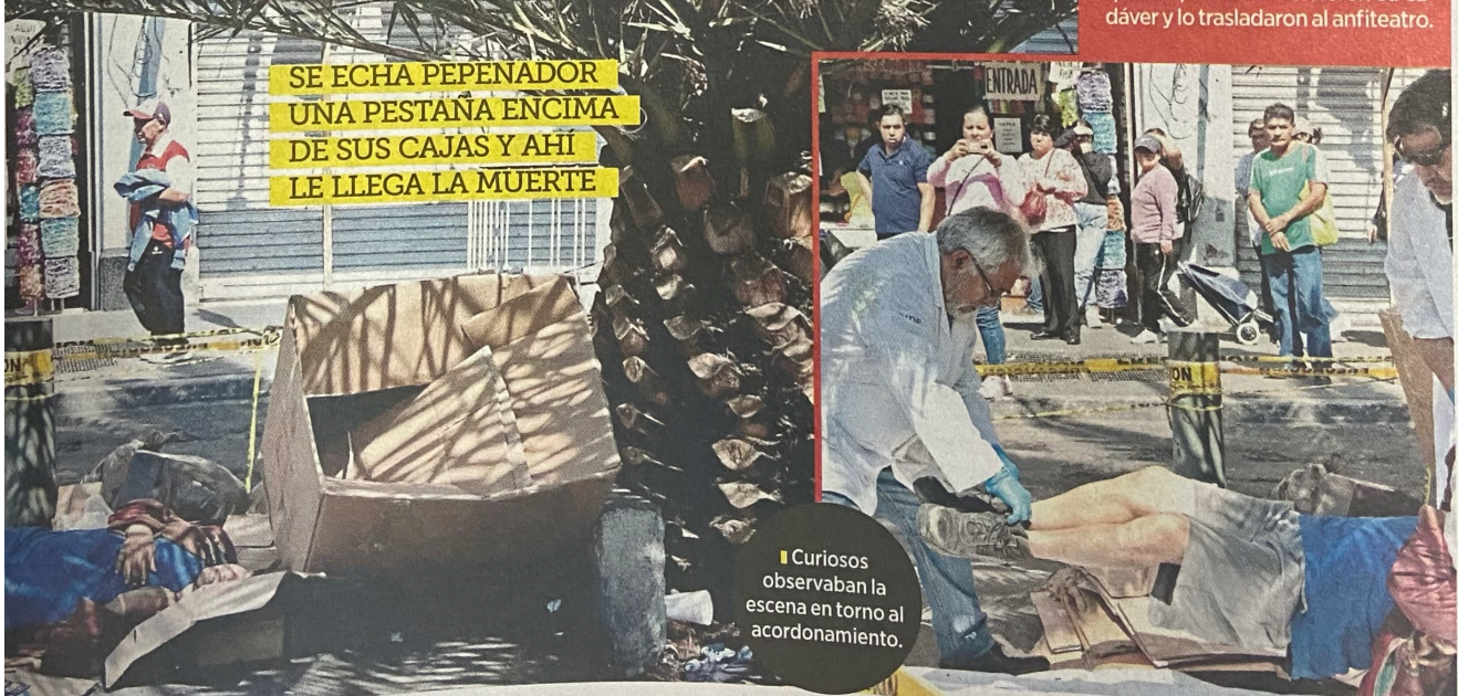
Curiosos observaban la escena en torno al acordonamiento.

SE ECHA PEPENADOR UNA PESTAÑA ENCIMA DE SUS CAJAS Y AHÍ LE LLEGA LA MUERTE