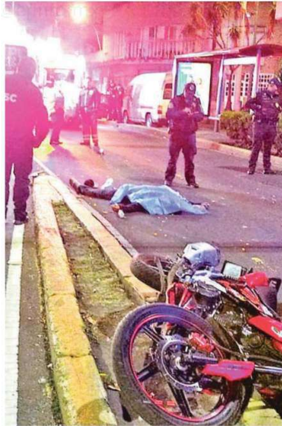
El accidente tuvo lugar en la colonia Portales Sur, alrededor de las 5:00 horas del pasado domingo