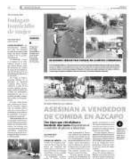
Los comensales fueron testigos del artero asesinato