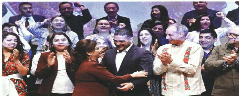
La candidata arrancó ayer su precampaña en compañía de Hugo López-Gatell y Omar García Harfuch.