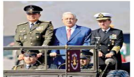
El presidente López Obrador (centro), acompañado de los titulares de Sedena, Luis Crescencio Sandoval, y Semar, Rafael Ojeda.

En el documento publicado en el Diario Oficial de