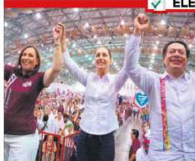
Tiempo de mujeres. Sheinbaum dijo que estará a la altura de las circunstancias y dará continuidad.