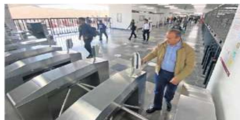
Los torniquetes instalados en Pantitlán, en las líneas 9 y A, como en la 1 y 2, requieren mantenimiento.

El Metro destacó en el informe que envió al Congreso de la Ciudad de México que el mantenimiento