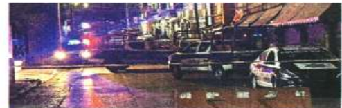
Las balaceras entre sicarios y policías se extendieron ayer por al menos cuatro colonias de Cuernavaca.