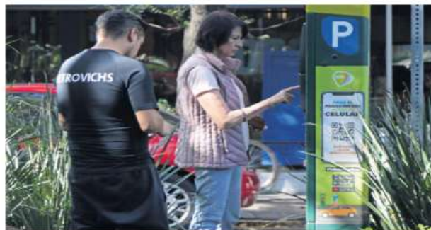
En la última década (2012-2022), la suma de ingresos por estacionamiento en vía pública de EcoParq fue de 3 mil 561 millones 979 mil 866 pesos, según reportes de Semovi.

tema. En la alcaldía Miguel Hidalgo aparece el proyecto de cruces seguros Palmitas, que tuvo un costo de 10.50 millones de pesos; la etapa 1 de la rehabilitación de avenida Thiers en la colonia Anzures, la cual tuvo un costo de 8.40 millones de pesos; y en la colonia Lomas se realizó un proyecto de cruces seguros por 10.50 millones de pesos.