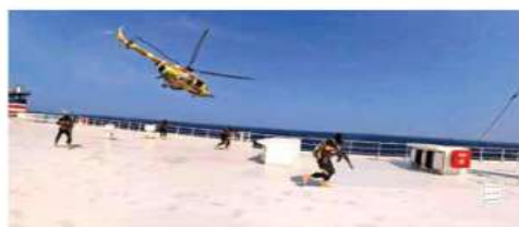
En un video que se viralizó ayer se puede observar cómo fue secuestrado el buque Galaxy Leader, en el Mar Rojo.