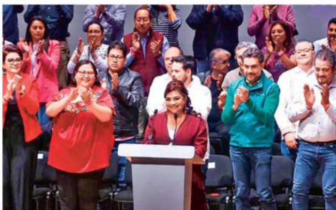
UNIÓN. La precandidata de la alianza Morena, PT y PVEM estuvo acompañada de representantes de los partidos así como legisladores locales y federales.

Contrastó la unidad en su alianza porque