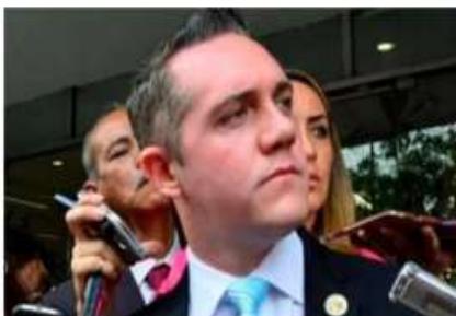
Comentó que desconoce si se aproxima una salida masiva de funcionarios y legisladores del PRI.