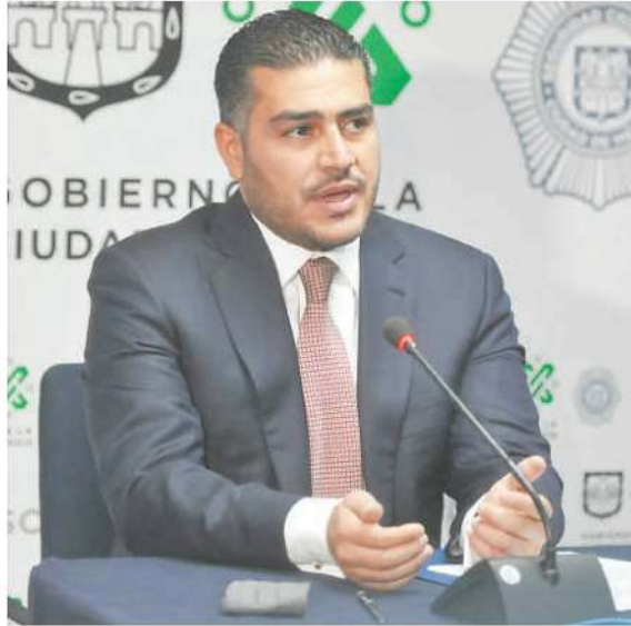
La jefa de Gobierno dijo que García Harfuch combate a la delincuencia

“Que quede muy claro, la verdad sobre Ayotzinapa, nuestra confianza en el trabajo que hace el fiscal General de la República y nuestra confianza al Presidente de la República y a todo el equipo de Gobierno de que se va a llegar a la verdad”, comentó.