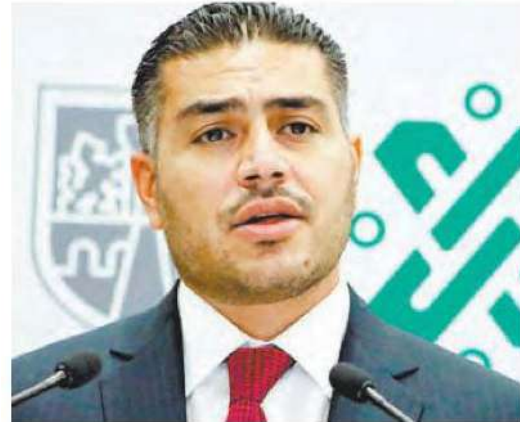
Rechaza tener vínculos con Guerreros Unidos

La jefa de Gobierno reiteró que en su administración no se negocia ni se pacta con criminales, prueba de ello dijo, son las órdenes de aprehensión que se han girado en contra de exfuncionarios capitalinos.