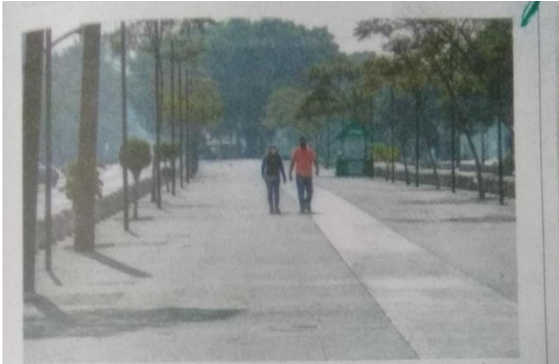
ARCHIVO ROBERTO HERNÁNDEZ