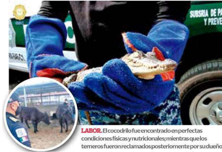
LABOR. El cocodrilo fue encontrado en perfectas condiciones físicas y nutricionales; mientras que los temerosos fueron reclamados posteriormente por su dueño.