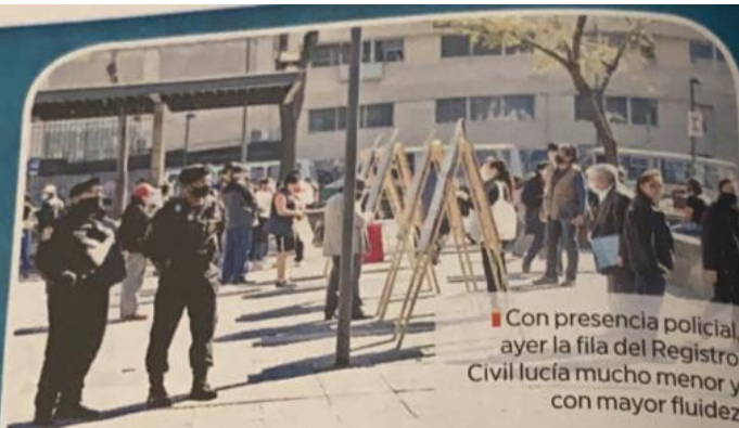
Con presencia policial, ayer la fila del Registro Civil lucía mucho menor y con mayor fluidez.