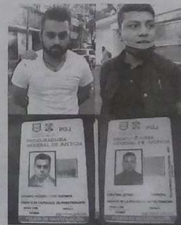
Resultaron vulgares hampones

Al efectuarles una inspección, los uniformados les encontraron 47 bolsitas con marihuana, las cuales utilizaban para amenazar a personas que detenían con sembrárselas sino les entregaban fuertes cantidades de dinero.