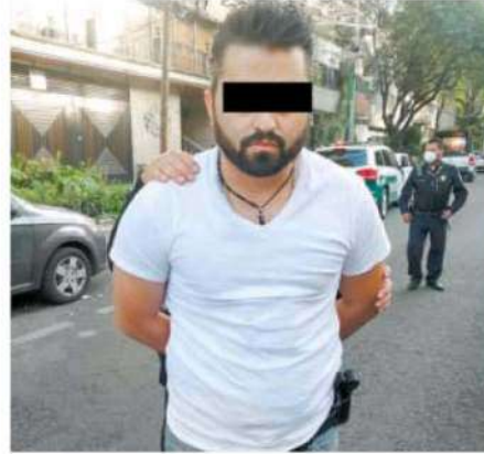
Ambos están a investigación por secuestro y narcomenudeo