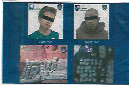
Los elementos policiacos detuvieron a Luis "N" y Said "N"