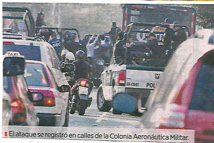
El ataque se registró en calles de la Colonia Aeronáutica Militar.

Por ello, los policías intentaron salir de la zona de manera ágil para trasladarse a la agencia del Ministerio Público que se ubica en la Alcaldía.