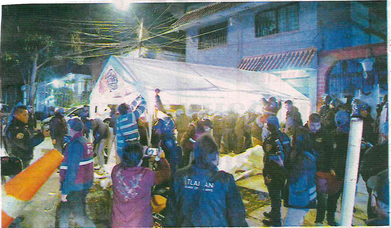
El gobierno tlalpense realiza dichos operativos anti-chelerías en cuatro zonas identificadas como las de mayor presencia de este tipo de negocios ilegales