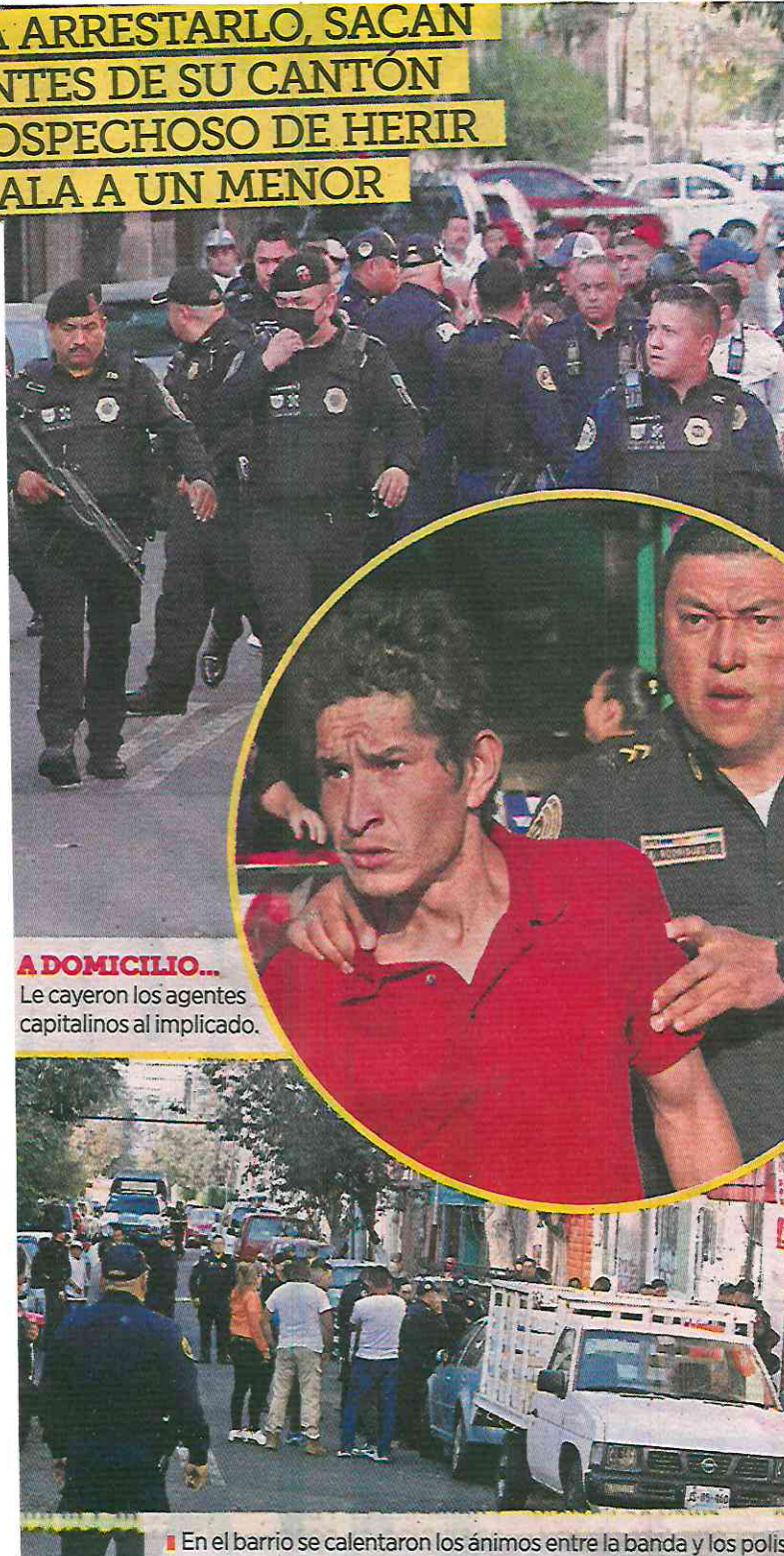
A DOMICILIO... Le cayeron los agentes capitalinos al implicado.