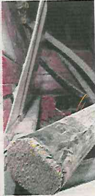
FRANCISCO RODRIGUEZ, EL GRÁFICO

Las autoridades ministeriales investigan desde cuándo operaba este grupo de ladrones y los sitios donde vendían el material que robaban, así como otros posibles cómplices.