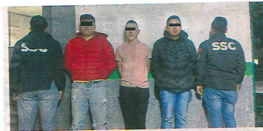
Uniformados de la SSC lograron capturar a los señalados, identificados como Víctor Manuel "N", Uriel "N" y Efrén "N"

putados fueron presentados ante la Fiscalía de Investigación del Delito de Narcomenudeo, ubicada en la colonia del Gas, en la alcaldía Azcapotzalco, donde se inició una carpeta de investigación en su contra. En las próximas horas se definirá su situación legal.