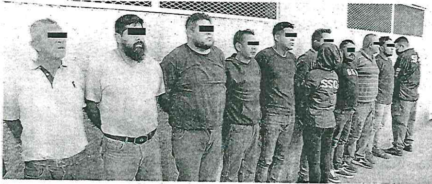
Detención de 9 hombres y dos mujeres menores de edad por el robo de cable de telefonía de Telmex