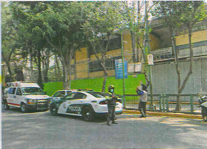
El jueves cinco estudiantes sufrieron malestares por ingerir fármacos

"Se ha iniciado una indagatoria y se está trabajando en conjunto con los compañeros de la Subsecretaría de Inteligencia de Investigación Policial de campo, con la Canifarma y directivos de escuelas de nivel medio superior para identificar de