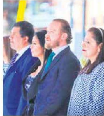
En la mira. Santiago Taboada, alcalde de Benito Juárez, ayer.