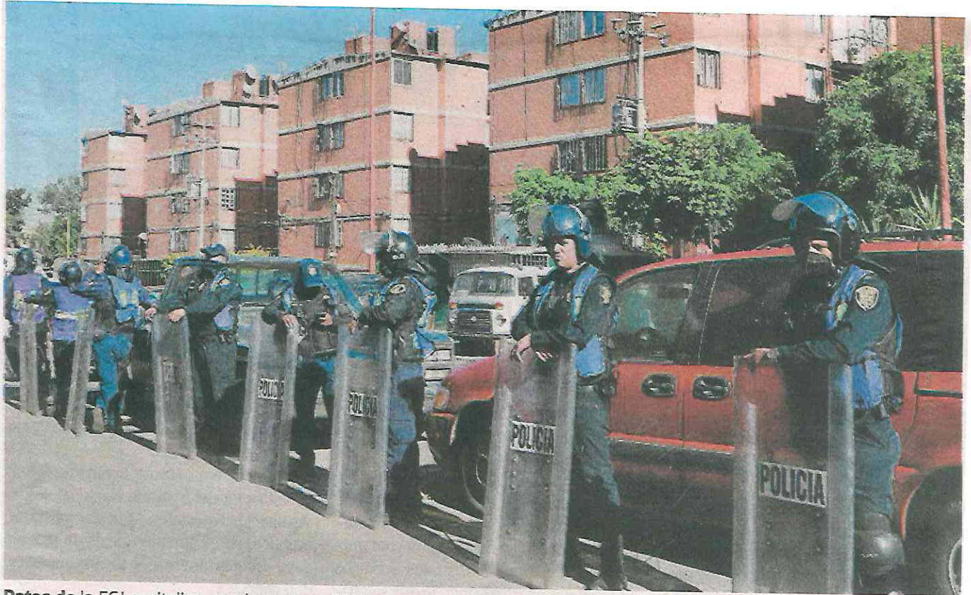
Datos de la FGJ capitalina, revelan que en 2014 se presentaron tres mil 49 denuncias por despojo, mientras que en 2019 se registraron tres mil 994