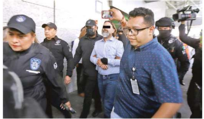
Una vez que arribó a la Ciudad de México, custodiado por agentes de la Policía de Investigación, fue ingresado al Reclusorio Preventivo Varonil Norte