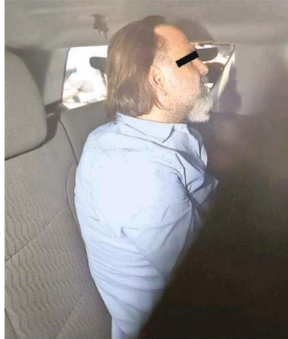
Exdiputado local fue trasladado de Reynosa, Tamaulipas, a la Ciudad de México

Las investigaciones establecieron que esta persona posiblemente realizó la construcción de un complejo habitacional ubicado en la calle Adolfo Prieto, en la colonia Acacias, también en la alcaldía Benito Juárez, y excedió el límite de pisos. De acuerdo con las investigaciones, René "N", entonces funcionario público en dicha demarcación, posiblemente otorgó la autorización correspondiente.