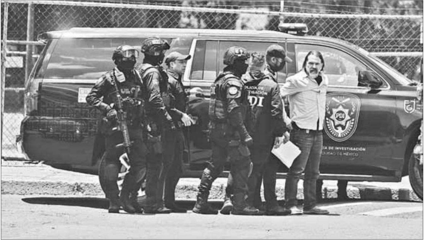
▲ En medio de un fuerte dispositivo de seguridad el panista fue trasladado de la FGJ al Reclusorio Norte.