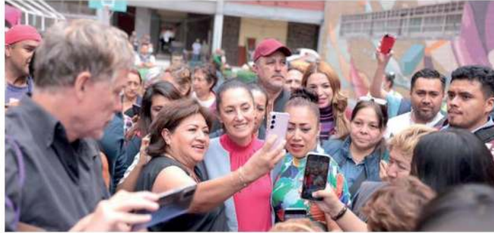
Reparan andadores en calles de la alcaldía Benito Juárez

Falso que el sistema de justicia de CDMX no haya actuado contra funcionarios y colaboradores de Morena