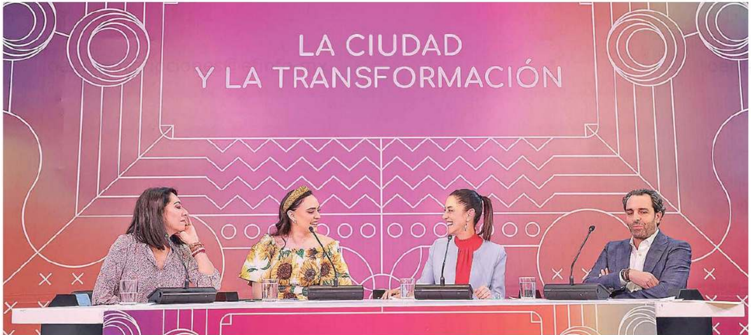
La jefa de Gobierno manifestó que la seguridad en la CDMX ha mejorado y tan es así que siguen llegando turistas