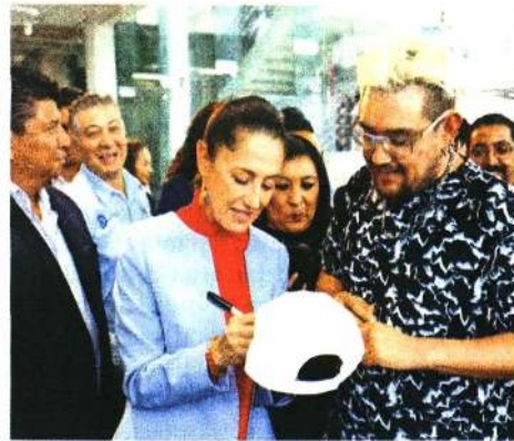
Claudia Sheinbaum dijo que la CDMX es una de las entidades donde han bajado los homicidios.

emitió la Embajada de EU luego del asesinato de una persona en Plaza Carso.