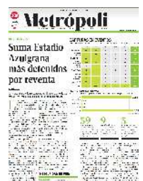
Gráfico: Alejandro Gómez