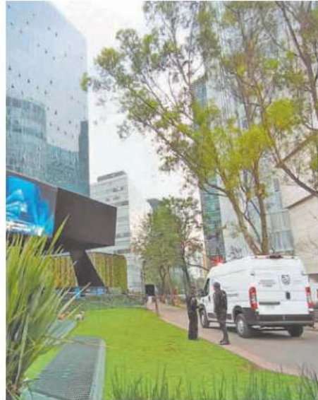
La víctima era buscada en EU