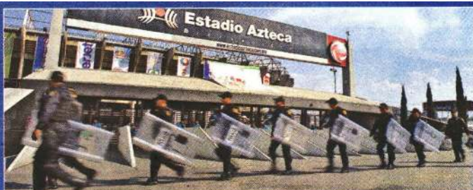
Elementos de seguridad resguardan las entradas del Azteca.

lleguen al estadio en autobuses y arengando como grupo de animación no entrarán y sacarán del estadio a los que tengan un mal comportamiento.