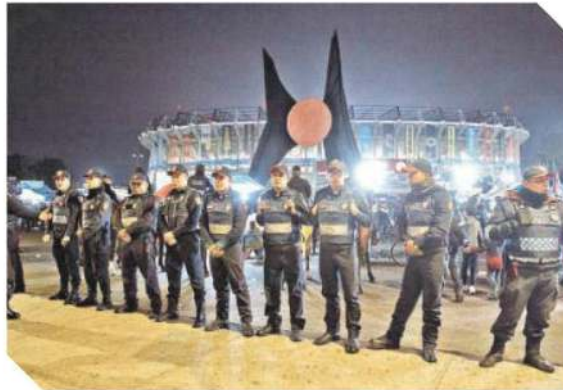
La Secretaría de Seguridad Ciudadana tendrá un bunker en el Coloso de Santa Úrsula.

En tanto, personal de Tránsito implementará un dispositivo de vialidad con cortes a la circulación y brindará rutas alternativas a los conductores, para garantizar la movilidad de los peatones, así como de los automovilistas.