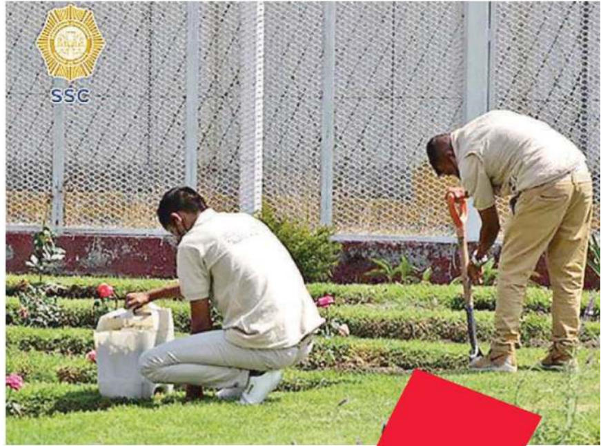
Deben cumplir con los requisitos de selección para realizar alguna actividad productiva

"Las personas privadas de su libertad no reciben un salario por concepto de las actividades que desarrollan"