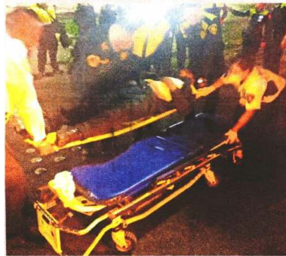
El agente arrollado fue llevado en ambulancia al hospital.