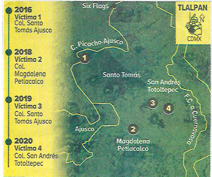
Gráfico: Abraham Cruz

De acuerdo con las investigaciones, Arturo primero elegía a las mujeres y las hacía sus pasajeras, luego las convencía de que fueran su pareja y las mataba.