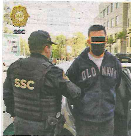
El hombre de 40 años de edad puso resistencia e intentó agredir a los oficiales de la policía capitalina

Por lo anterior, el detenido fue presentado ante el agente del Ministerio Público, quien integrará la carpeta de investigación correspondiente para determinar su situación jurídica.