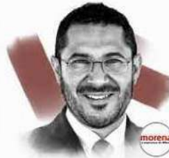
Martí Batres Jefe de Gobierno