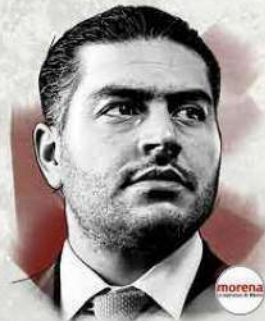
Salomón Chertorivski Diputado federal por Movimiento Ciudadano

► De Morena, está el secretario de Seguridad Ciudadana, Omar García Harfuch, quien no ha mostrado interés de competir por el cargo ► No obstante, hay estudios que lo colocan como uno de los mejores perfiles para ganar la jefatura de Gobierno en 2024 por Morena. ► Una encuesta de CEO Online de julio de 2023, señala que García Harfuch es el perfil mejor posicionado para encabezar la candidatura de Morena a la jefatura de Gobierno con un 27 por ciento de las preferencias.