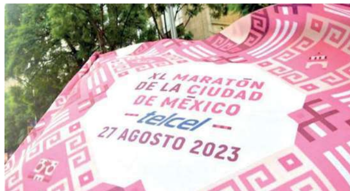
La medalla es un homenaje a la Torre Latinoamericana y se entregará una playera inspirada en la mujer chiapaneca