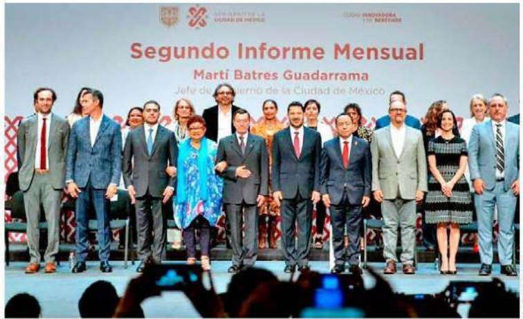
PILAR. El mandatario local recordó que un buen gobierno debe atender a todos, pero especialmente a quienes se encuentran en alguna situación vulnerable.