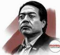
Mario Delgado Presidente de Morena