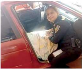
Orgullosas de su labor