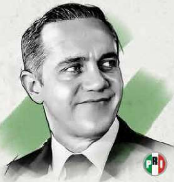
Adrián Rubalcava Suárez, Alcalde de Cuajimalpa

► Rubalcava Suárez ha ganado 3 elecciones para gobernar Cuajimalpa y ha mantenido la demarcación para el Partido Revolucionario Institucional (PRI). ► La encuesta de CEO Online de julio de 2023, coloca a Rubalcava Suárez como el segundo perfil más posicionado con el 18 por ciento de las preferencias para ser el candidato de la oposición.