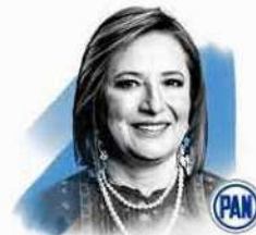
Xóchitl Gálvez Aspirante a la Presidencia de la República

► En 2022, Xóchitl Gálvez afirmó que buscaría ser la jefa de Gobierno de la capital. No obstante, apenas en junio pasado, informó que iba a registrarse en el proceso para ser la candidata a la presidencia del Frente Amplio Por México.