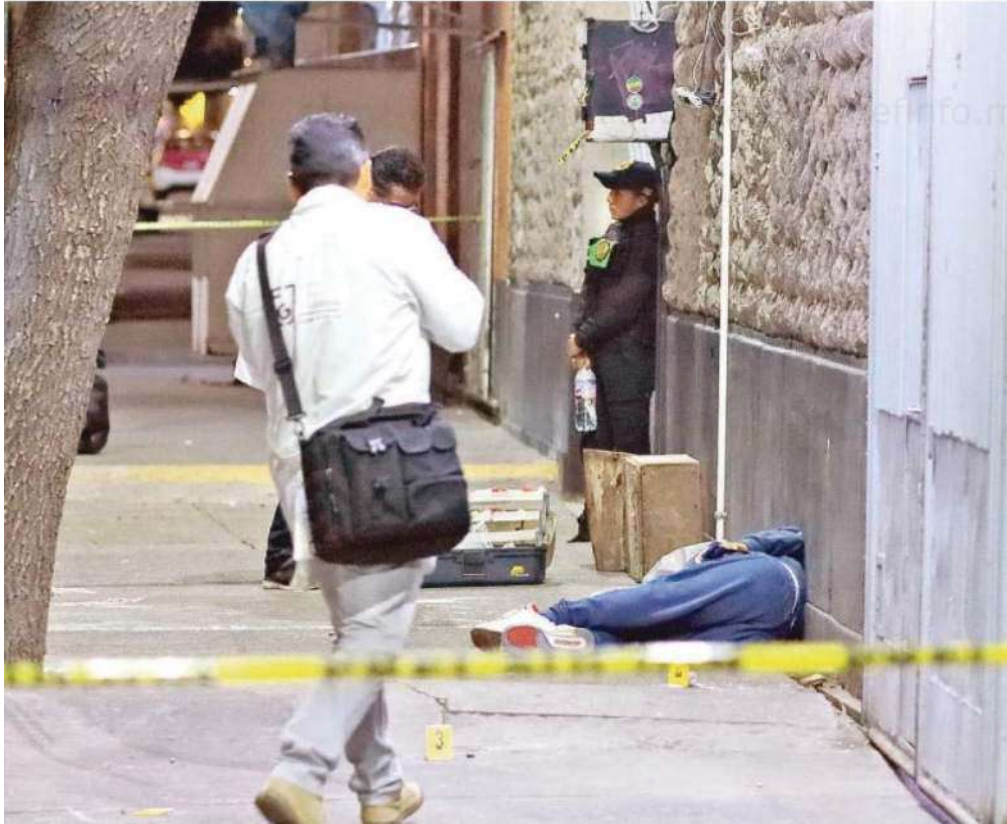
Un hombre fue asesinado a balazos por dos sujetos que huyeron en moto /GUILLERMO PANTOJA