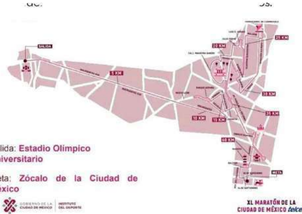
Recorrido del Maratón CDMX 2023

Será en las principales vialidades de la CDMX, con una ruta total de 42,195 metros; la salida es en Avenida Insurgentes Sur, entre el edificio de la Biblioteca Central y el Estadio CU; para llegar al Zócalo