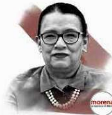
Rosa Icela Rodríguez Secretaria de Seguridad Ciudadana y Protección Ciudadana