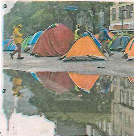
Cerca de un charco, las casas de campaña sobre Avenida Juárez

"Y me llama mucho la atención el lenguaje, como que se quedaron por ahí de la Guerra Fría, más o menos, se les olvidó que ya se cayó el Muro de Berlín, que ya la Unión Soviética ya no existe, como que se quedaron ahí con un lenguaje de los ochentas, pues ya cada uno puede usar el lenguaje libre expresión, pero sí vale la pena escucharlo para ver cómo manifiestan su manera de pensar".