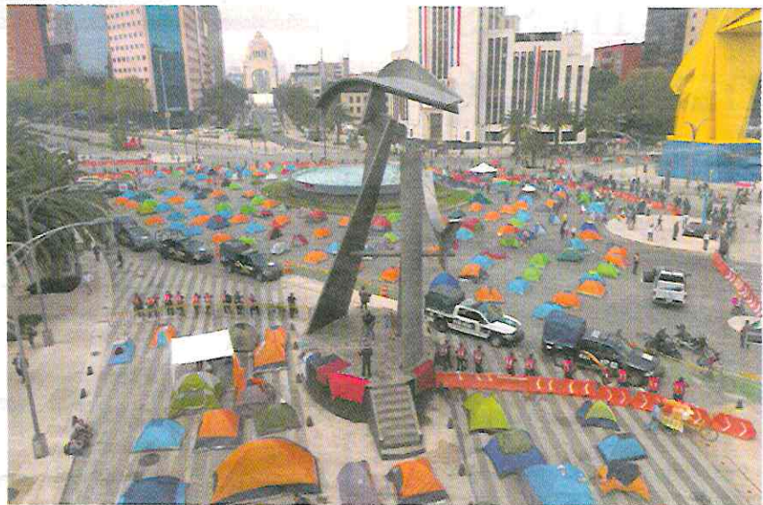
CAMPAMENTO de Frena en en Centro Histórico, custodiado por policías, ayer.

INSTALAN MIL casas de campaña en el campamento de Avenida Juárez; al menos 250 están vacías; algunos se cooperan para comprar comida, otros van a restaurantes