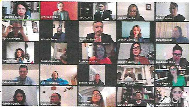
EL SECRETARIO, ayer, en reunión virtual con diputados locales.

TITULAR DE LA SSC comparece ante diputados del Congreso local por el Segundo Informe de Gobierno; estos grupos operaban con total impunidad, a la vista de todos, sostiene