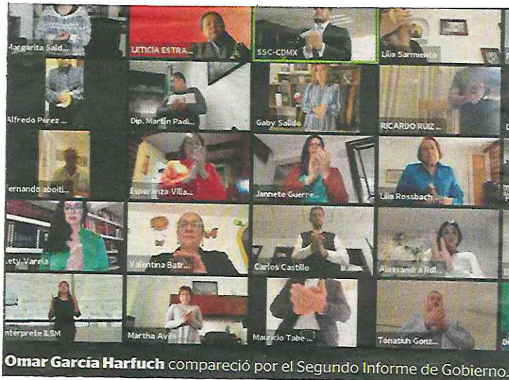
Omar García Harfuch compareció por el Segundo Informe de Gobierno.

García Harfuch detalló que el robo al interior del Metro disminuyó 72 por ciento; robo a bordo de microbús, 48 por ciento; robo a bordo de taxi, 46 por ciento; robo a transeúnte, 42 por ciento; lesiones por arma de fuego, 39 por ciento; robo a negocio, 26 por ciento; robo a cuentahabiente, 36 por ciento; robo de vehículo con violencia, 26 por ciento; robo de vehículo sin violencia, 23 por ciento; robo a repartidor, 22 por ciento; robo a transportista, 18 por ciento; y robo a casa habitación, 17 por ciento.