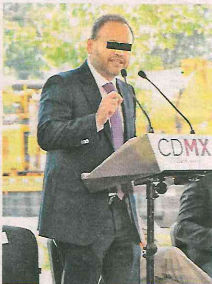
La Fiscalía General de Justicia de la CDMX busca a Jaime "S" por detrimento económico a la hacienda pública capitalina

Es necesario señalar que el representante social de la Fiscalía General de Justicia también integra otras investigaciones