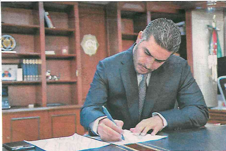
El secretario de Seguridad Ciudadana, Omar García Harfuch, destacó avances en el objetivo de reducir la violencia en la capital del país

Se logró el debilitamiento de organizaciones delictivas que operaban con total impunidad a la vista de todos en la Ciudad de México. Este trabajo no ha terminado y continuamos día a día y semana tras semana con detenciones relevantes"