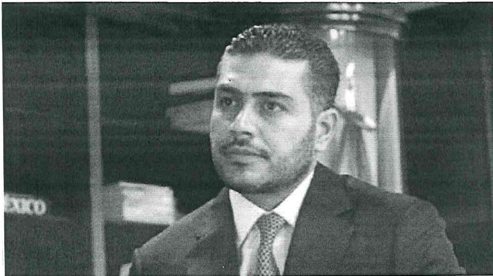
Omar García Harfuch, secretario de Seguridad Ciudadana, durante su Segundo Informe.