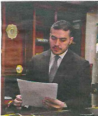
CONGRESO. De forma virtual, compareció el jefe de la Policía.