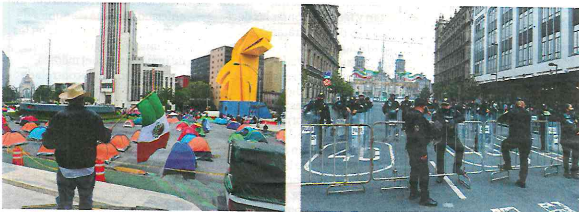
PROTESTA. Para evitar confrontaciones, policías capitalinos cuidan a los manifestantes y a los seguidores del Presidente.

A mediodía, en entrevista radiofónica, Gilberto Lozano reiteró que la intención es llegar a la Plaza de la Constitución para exigir la renuncia del presidente López Obrador.