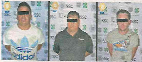
Los detenidos operaban en las alcaldías Xochimilco, Iztapalapa y Tláhuac.

Como parte de las acciones de reforzamiento de seguridad, sobre la calle Golondrina, colonia El Carmen, efectivos capitalinos observaron a tres sujetos que intercambiaban envoltorios por dinero en efectivo, a un costado de un automóvil color blanco, quienes al notar la presencia policial adoptaron una actitud inusual e intentaron abandonar el lugar.