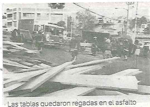
Las tablas quedaron regadas en el asfalto

La circulación en avenida Observatorio resultó muy afectada durante los trabajos para retirar el vehículo.