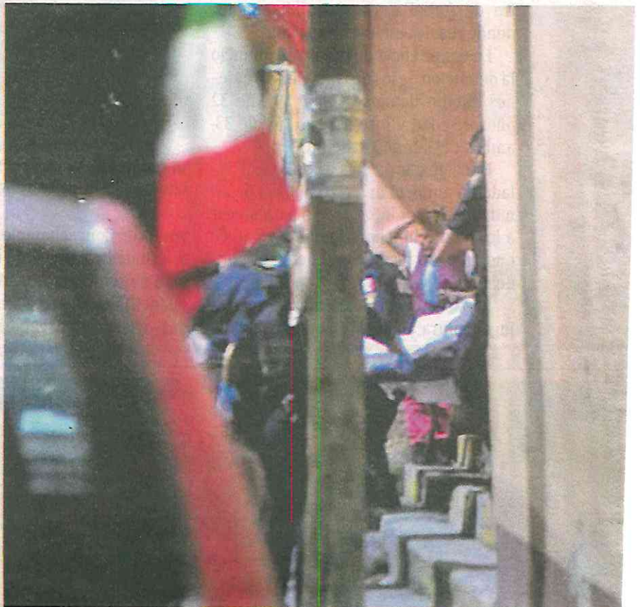
Un hilillo de sangre evidenciaría la ruta de escape de la víctima mortal

La escena del crimen fue resguardada por policías capitalinos, donde se podían observar varios casquillos percutidos y un rastro de sangre a través de las escaleras donde se cree la víctima trató de huir de sus asesinos.