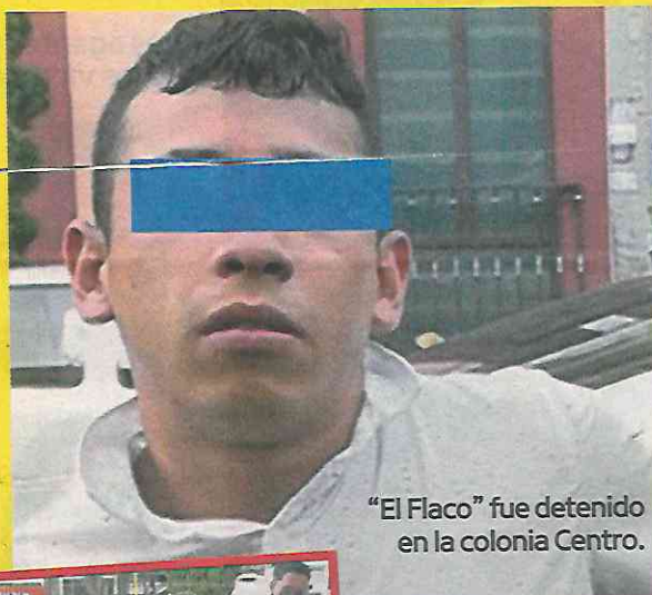
"El Flaco" fue detenido en la colonia Centro.

En la zona centro, los choferes de la ruta 22 tienen que dar 500 pesos semanales, aunque en ocasiones la cifra varía, según se anota en las indagatorias.