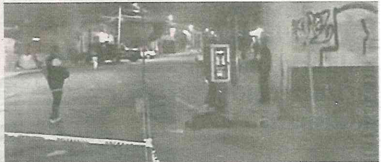
Le dispararon a quemarropa

Las autoridades informaron que un presunto compañero de parranda del hoy occiso fue detenido y presentado ante el Ministerio público en la Coordinación Territorial IZP-6.