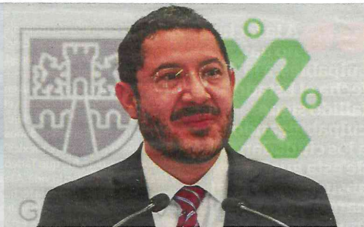
El secretario de Gobierno, Martí Batres, dijo que han recibido desde pistolas de salva hasta fusiles de asalto de uso exclusivo del ejército.

En total en los tres años del programa, han participado 4 mil 596 habitantes de las 16 alcaldías de la ciudad, de los cuales, 60 por ciento son hombres y 40 por ciento mujeres.