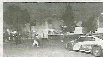
Se ignora móvil del crimen

Hasta el momento se ignora el móvil del brutal asesinato, aunque todo apunta a que se trató de un ajuste de cuentas y, al parecer, la víctima andaba tomando con sus verdugos.