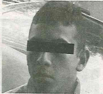
El extorsionador está preso

De acuerdo con las investigaciones este joven es uno de los presuntos operadores de los cabecillas de la organización criminal El Tío Myke y de El Chori y entre sus actividades ilícitas se