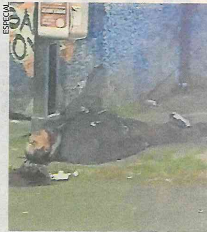
La víctima recibió un impacto de bala en la barbilla, que le quitó la vida.

Con las características proporcionadas, los policías ubicaron a los tres sospechosos sobre la calle Emilio P.