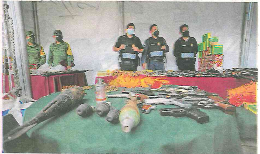
Con relación a las granadas, se han recabado de fragmentación, de instrucción, de gas, mortero y calibres 40 y 20

El funcionario informó que del 1 de enero al 20 de septiembre pasado se han entregado 273 armas, de las cuales 183 fueron cortas, 49 largas y se recibieron 41 granadas, así como 20 mil 55 estopines y 16 mil 163 cartuchos en los que se pagó un monto de 964 mil 303 pesos por ese canje anónimo.