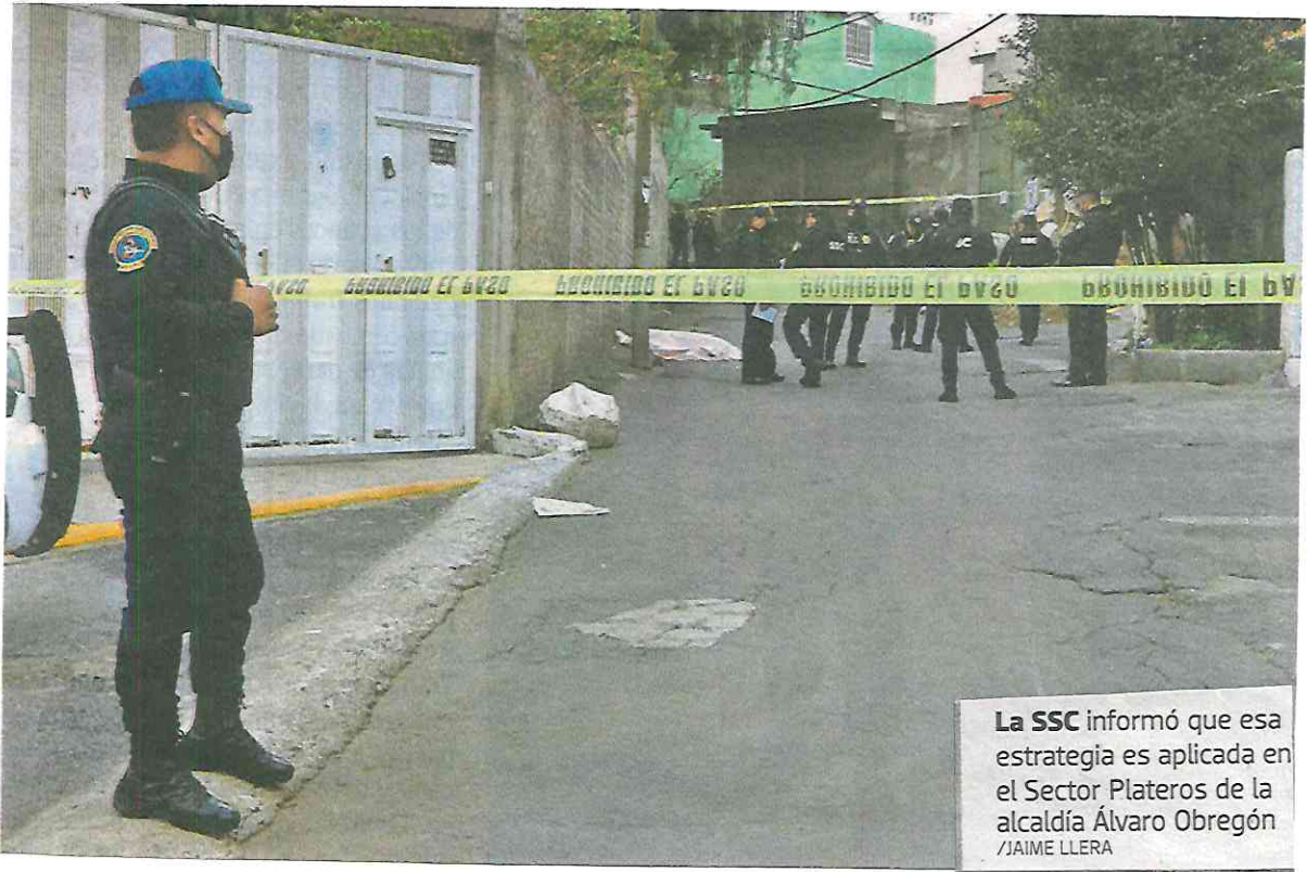
La SSC informó que esa estrategia es aplicada en el Sector Plateros de la alcaldía Álvaro Obregón