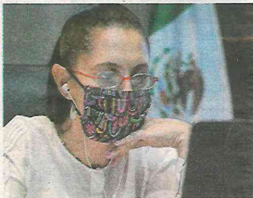
En la audiencia pública virtual, de ayer

“Lo importante es que es un programa de fondo, muy humanista, en el sentido de retirar las armas. En mu-