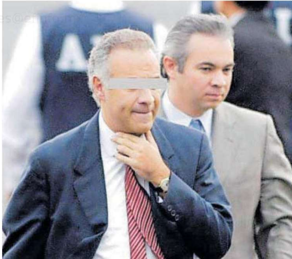
El abogado ha tenido problemas de salud.