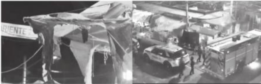
Se trató de una advertencia de criminales