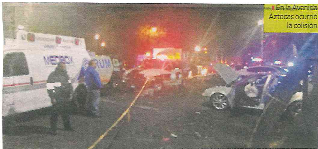
En la Avenida Aztecas ocurrió la colisión.