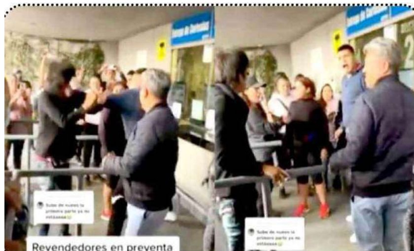
Revendedores en preventa

Destacó que su personal mantuvo el despliegue operativo hasta el término del concierto y el desfogue total de los asistentes , en tanto, los policías de la Subsecretaría de Control de Tránsito agilizaron la vialidad en las principales avenidas y calles aledañas al lugar; así como en las estaciones del Metro y los paraderos de unidades de transporte público de la zona.