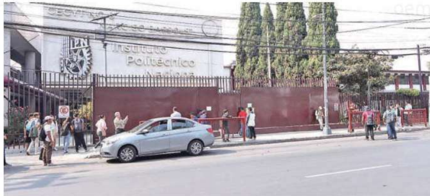
Los jóvenes golpearon a los guardias de seguridad, para después cerrar con cadenas y candados el plantel

Luego de los momentos de presión para las autoridades educativas y los estudiantes, ante el cierre de la escuela, fue reabierto pero sin clases para el turno vespertino