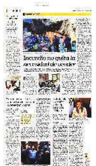
Los comerciantes aseguran que "hay que salir a chingarle" para recuperar todo lo perdido, luego del incendio en la Plaza Oasis que dejó afectaciones a más de 200 familias que dependen de la venta de calzado.