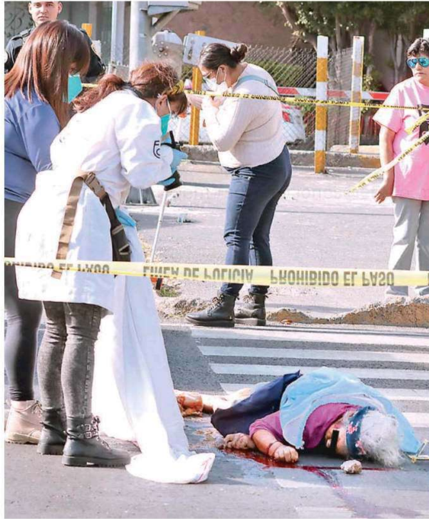
Nadie lloró la muerte de la abuelita, pues no fue reconocida en la zona, que permaneció acordonada