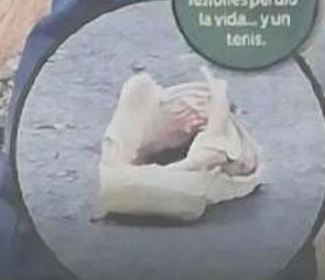
Por múltiples lesiones perdió la vida... y un tenis.