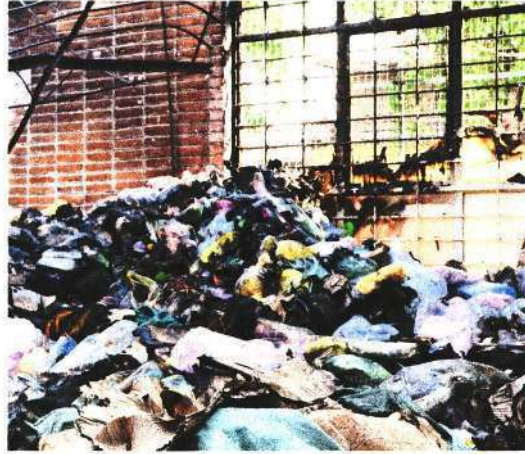
Locatarios calculan que la pérdida máxima fue de media tonelada de chanclas.