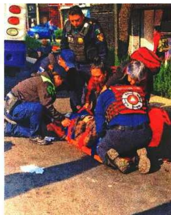
La mujer fue trasladada al hospital y el chofer fue detenido.

Las alcaldías con mayor registro fueron Cuauhtémoc, Iztapalapa, Benito Juárez, Miguel Hidalgo, Gustavo A. Madero y Coyoacán. ●