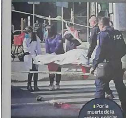
Por la muerte de la señora, policías pedían usar el puente peatonal.