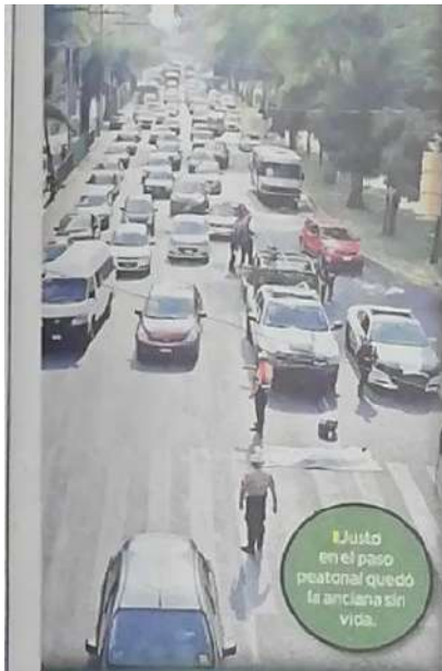
Justo en el paso peatonal quedó la anciana sin vida.