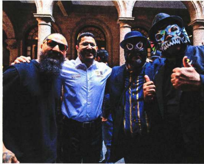
Martí Batres, jefe de Gobierno, dijo que el festival "es una forma de ejercer en los hechos los derechos de la juventud".