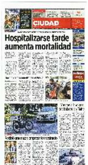
A MANSALVA. El empresario fue atacado a tiros por dos hombres antes de abordar su camioneta blindada.