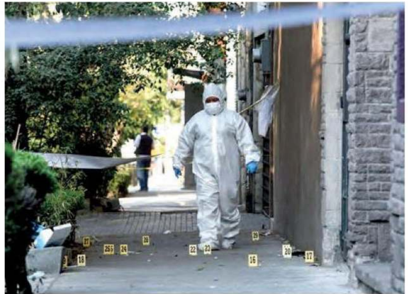
Peritos contabilizaron cerca de 30 casquillos percutidos

Las autoridades determinaron que el escolta muerto pertenecía a la Policía Bancaria e Industrial (PBI)