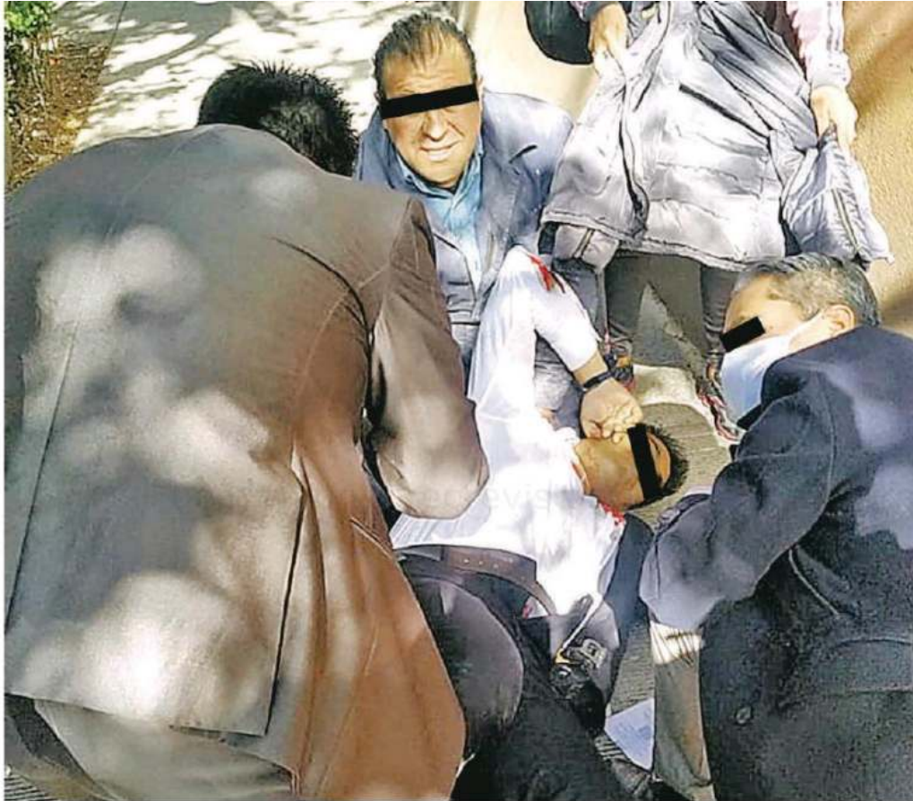
Una bala se alojó en el cráneo de la víctima, para arrebatarle la vida