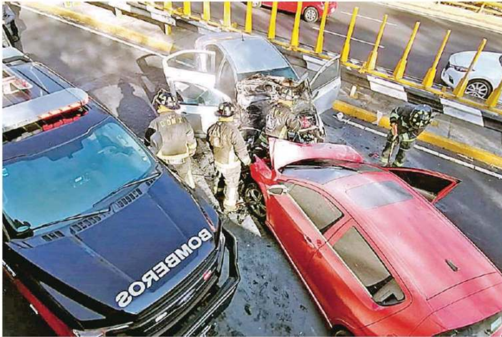
El conato de incendio en un vehículo apuró las labores de los vulcanos