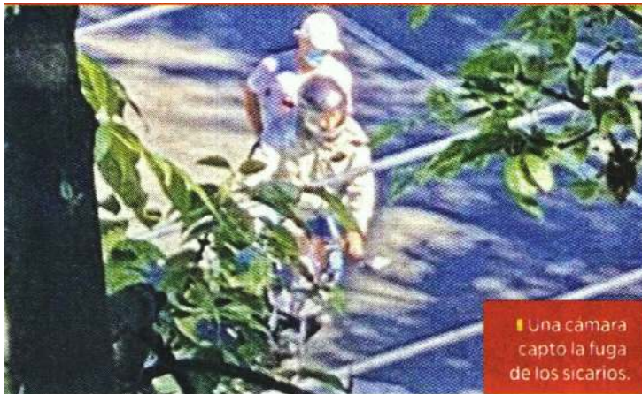
Una cámara captó la fuga de los sicarios.