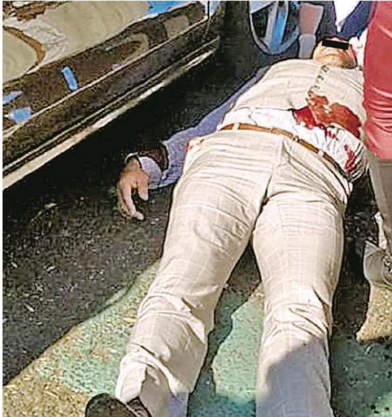
Los agresores lograron darse a la fuga