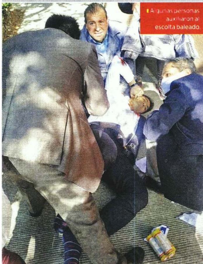
Algunas personas auxiliaron al escolta baleado.