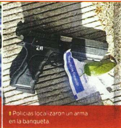
Policías localizaron un arma en la banqueta.