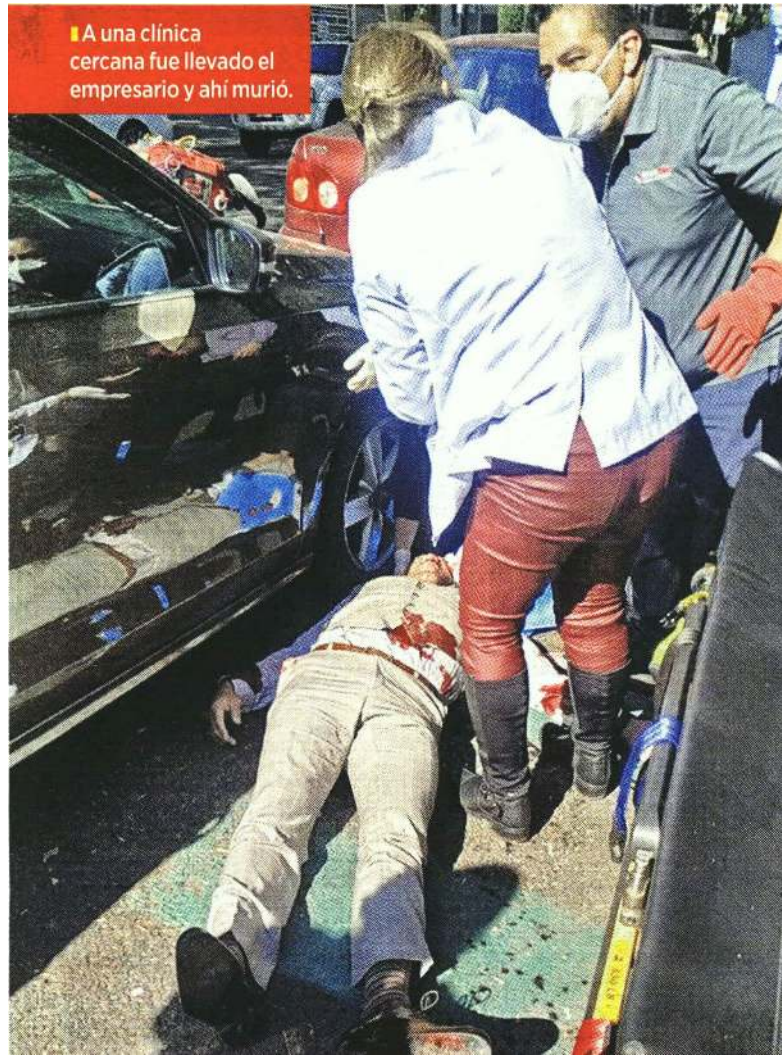
■ A una clínica cercana fue llevado el empresario y ahí murió.