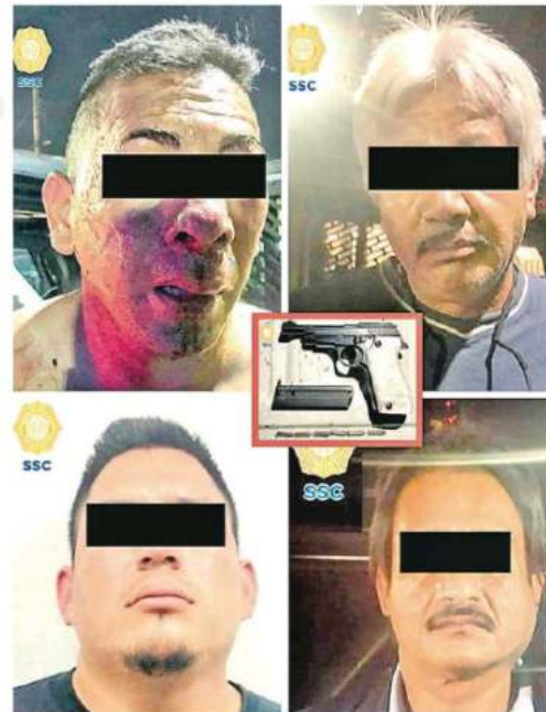
Fueron aprehendidos tras manipular un arma irresponsablemente

Policías de la SSC realizaban patrullajes de seguridad y vigilancia cuando fueron requeridos vía número de emergencias 911