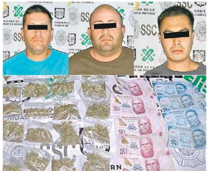
A estos sujetos se les detuvo en posesión de marihuana y cocaína

En tanto, el detenido de 25 años de edad, cuenta con una detención por Delitos Contra la Salud con una carpeta de investigación en el año 2019.