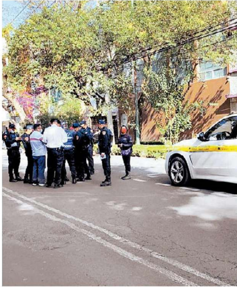
Elementos de la SSC realizan entrevistas a testigos. ESPECIAL