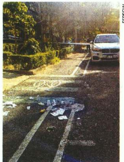
La balacera se dio sobre las calles Dakota y Georgia.

Además precisaron que el escolta era un elemento activo de la Policía Bancaria e Industrial (PBI) comisionado para labores de seguridad personal. ●