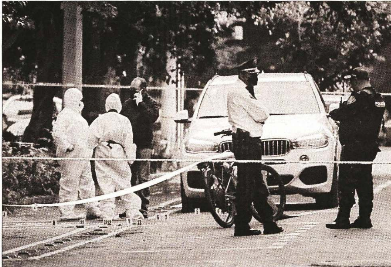
◀ Una camioneta de lujo, en la que llegó la víctima, fue resguardada por la policía.