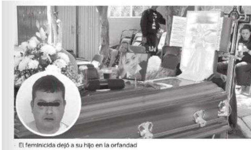
El feminicida dejó a su hijo en la orfandad