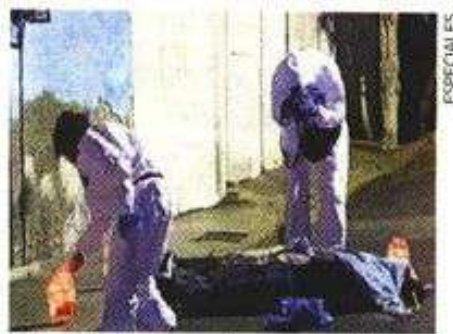
Autoridades investigan el móvil.

En la alcaldía Iztapalapa se perpetraron 13 homicidios dolosos por arma de fuego durante enero de este año.