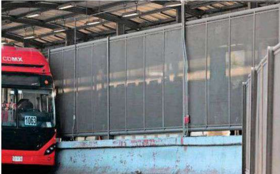
El deceso ocurrió la mañana de ayer, cerca de las 06:30 horas, en la Plataforma Indios Verdes de la Línea 1 del Metrobús