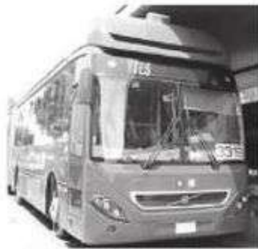
Aquí ocurrió la tragedia

Debido a la gravedad del caso, el servicio del Metrobús en esa línea se detuvo durante casi 2 horas