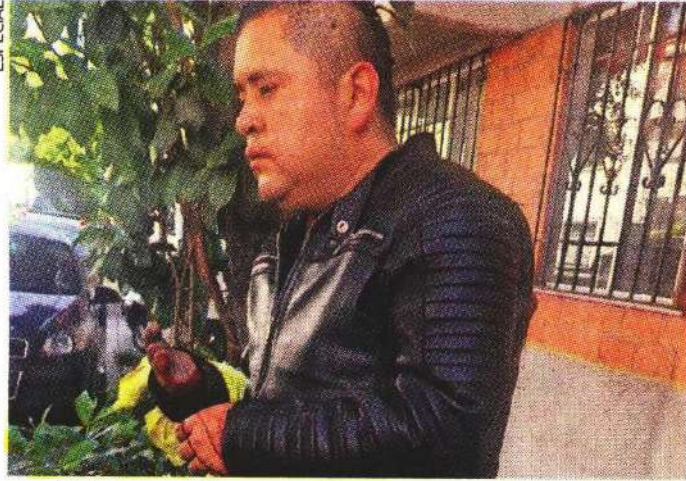
Los ladrones se fueron con las manos vacías.