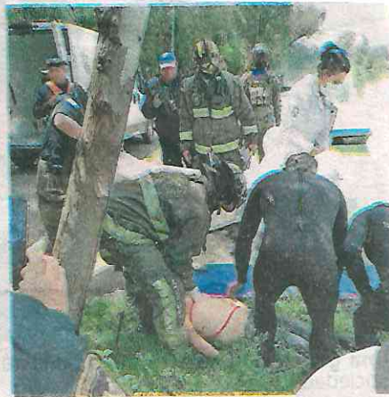
Lo vieron cerca del canal de Cuemanco y luego se arrojó para ahogarse

Cuando el hoy occiso, quien se alejó nadando, fue perdido de vista, se solicitó el apoyo de integrantes de la Policía Ribereña, mismos que en coordinación con