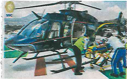
Durante el vuelo, brindaron atención prehospitalarias para estabilizar a la mujer