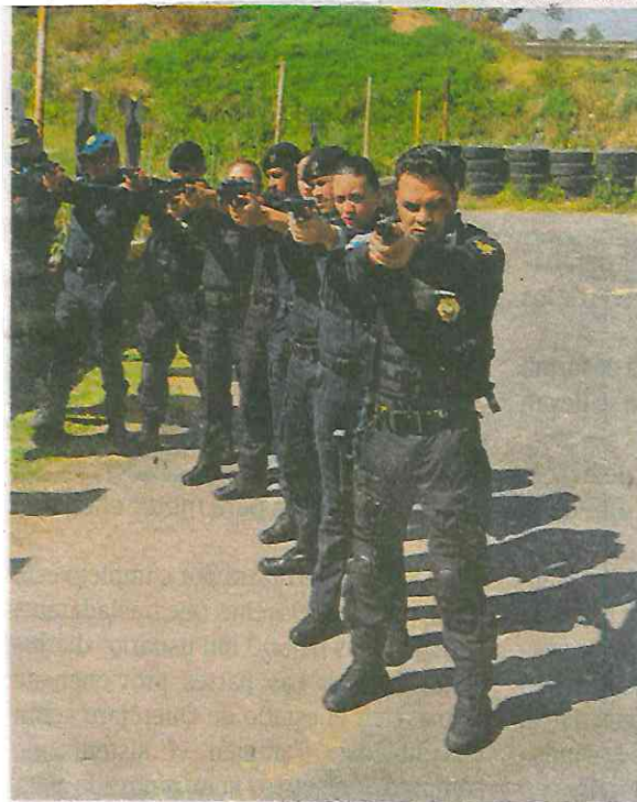
Los capacitación con pistolas es cosa del pasado