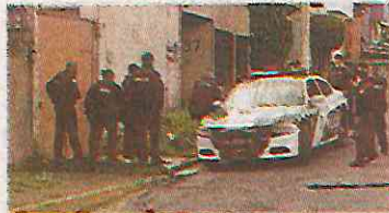
Tratan de identificar a la víctima

El cuerpo fue localizado la mañana de ayer por vecinos que salieron a barrer las banquetas de sus casas y notaron que frente al número 235 de la calle Chuburna casi esquina con Tekal, se encontraba un bulto, por lo que