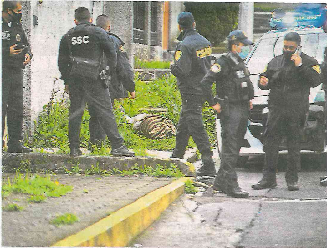
De acuerdo con las autoridades policíacas, el cadáver estaba envuelto en plástico y tenía huellas de torturas