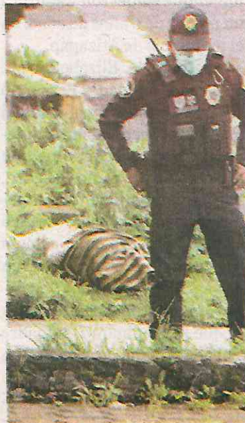
La policía investiga

pensaron que alguien había dio a tirar basura.