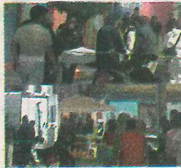
Se presume una venganza

De acuerdo con versiones de testigos, el hombre, de aproximadamente 32 años de edad, se encontraba en una taquería ubicada en las calles Rafael Sierra e Ignacio Cru-