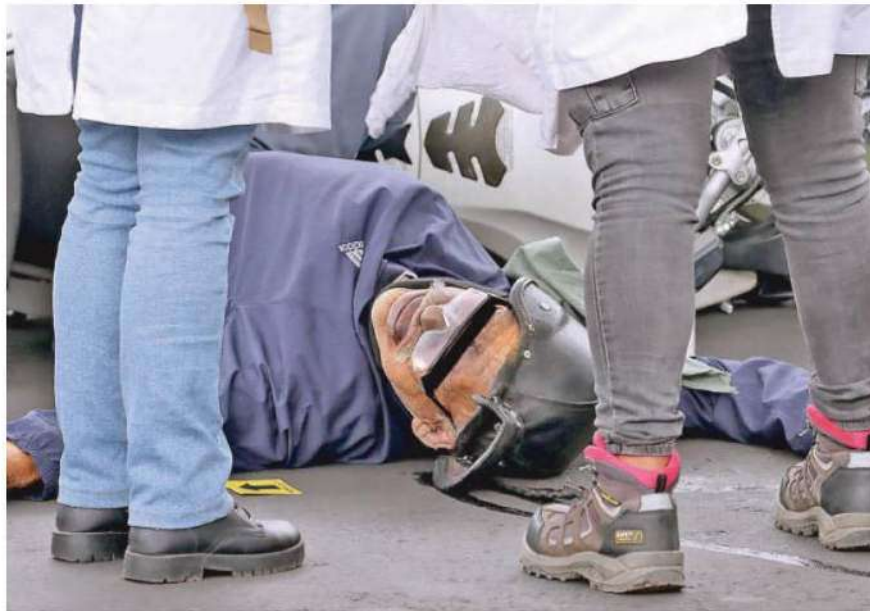
Se sabe que el motociclista no falleció a causa del golpe recibido al caer de su caballo de acero, sino que aparentemente sufrió una falla en el organismo, producto de alguna enfermedad