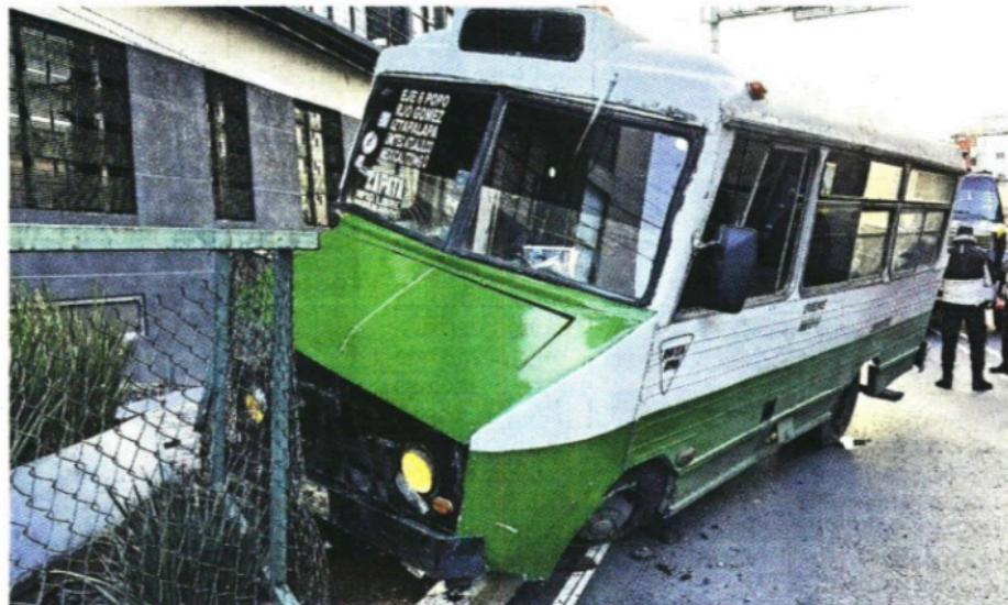
El microbús que chocó ayer por una falla mecánica fue fabricado en la década de los 80.

En total se sacarán de circulación 5 mil 800 vehículos (de los cuales ya van 2 mil 485), que representan el 90% de la plantilla total de microbuses y así evitar accidentes.