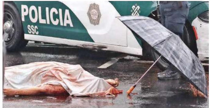
En el lugar se presentó una mujer de aproximadamente 30 años de edad, quien se identificó como hermana del hoy occiso