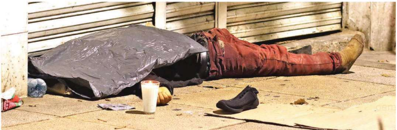
Vecinos de la zona y transeúntes que lo vieron recostado pero inmóvil sobre el piso, dieron aviso a las autoridades a través del 911