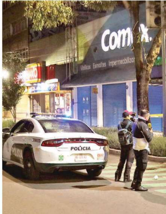
Policías llegaron al punto y trataron de despertar al joven pero ante la falta de respuesta solicitaron apoyo médico