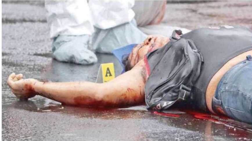
El hombre quedó recostado boca arriba, sobre un charco de sangre