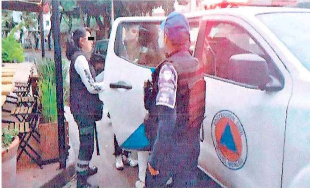
Una joven de 19 años violentada por su opadrastro fue rescatada por policías