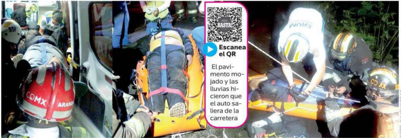
El rescate tardó varias horas debido a lo rocoso de la zona