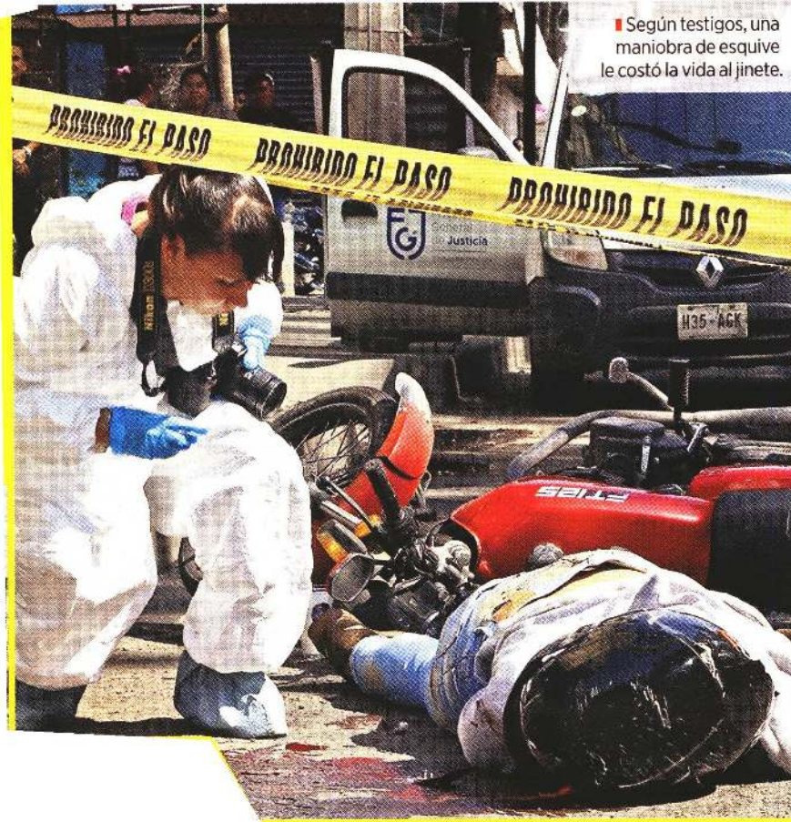
■ Según testigos, una maniobra de esquivo le costó la vida al jinete.