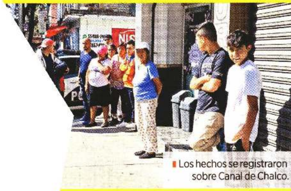
■ Los hechos se registraron sobre Canal de Chalco.