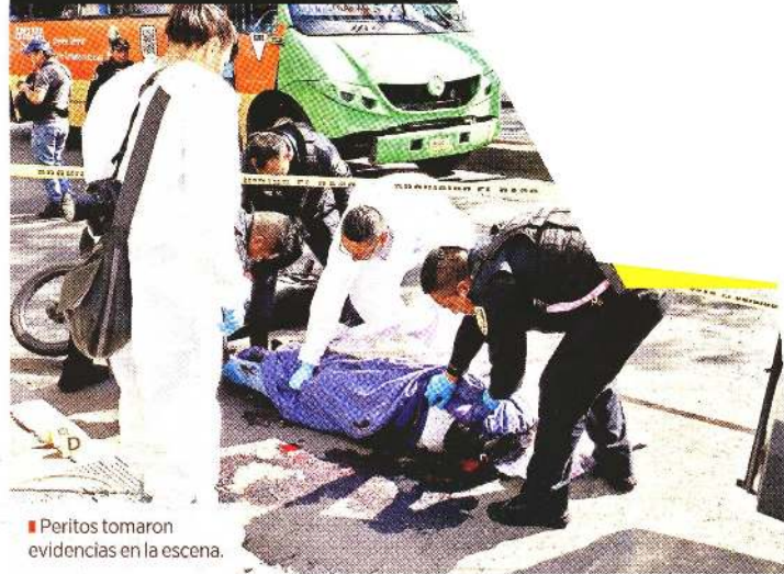
Peritos tomaron evidencias en la escena.

138 motociclistas HAN FALLECIDO EN ACCIDENTES VIALES EN EL VALLE DE MÉXICO DURANTE 2023