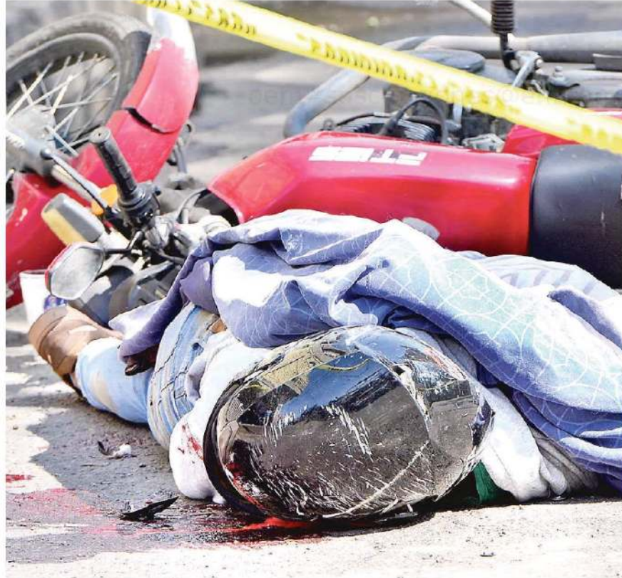
Motociclista derrapa y muere atropellado por camión de volteo, en Iztapalapa