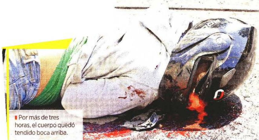
■ Por más de tres horas, el cuerpo quedó tendido boca arriba.