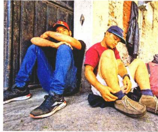
Migrantes denunciaron que algunos policías cobran 200 pesos por brindarles información sobre trámites.