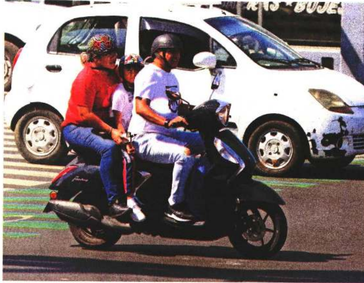
CARLOS MEJIA, EL UNIVERSAL

De no cumplir con el Reglamento de Tránsito, la sanción podría ser la remisión de la motocicleta al corralón, una multa que va de los 2 mil 74.80 pesos a los 5 mil 187 pesos, o de tres a seis puntos a la licencia para conducir ● Con información de Cinthia García