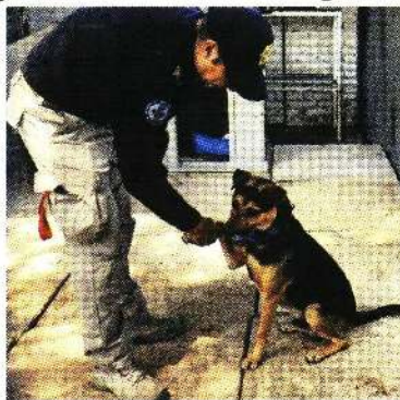
Ha mostrado su agradecimiento.

CASI LISTO El canino estrella de internet, tiene aproximadamente 3 años, pesa alrededor de 35 kilogramos y está por ingresar al programa de esterilización para, después de su alta médica, estar listo para ser adoptado.