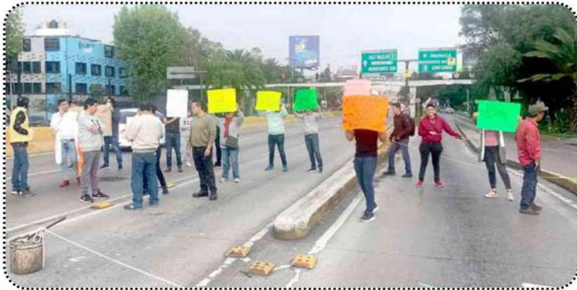
Habitantes bloquearon Circuito Interior; demandan reubicación de migrantes