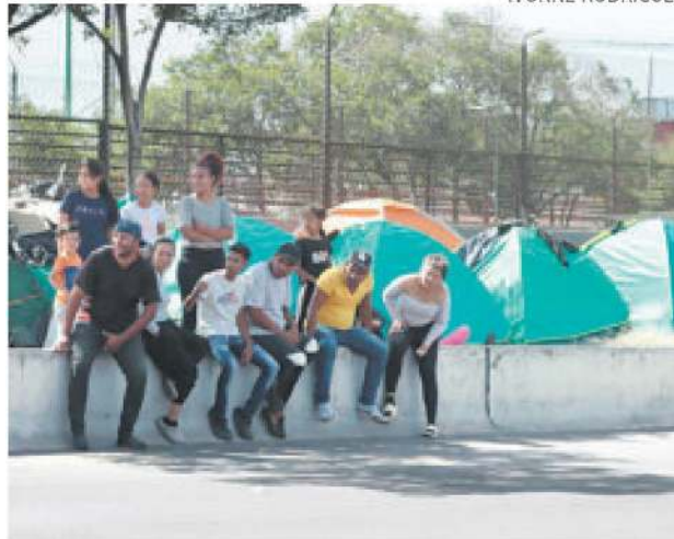
Familias de migrantes viven en un camellón