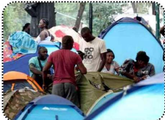
Migrantes viven en deplorables condiciones, que han detonado condiciones de insalubridad e inseguridad