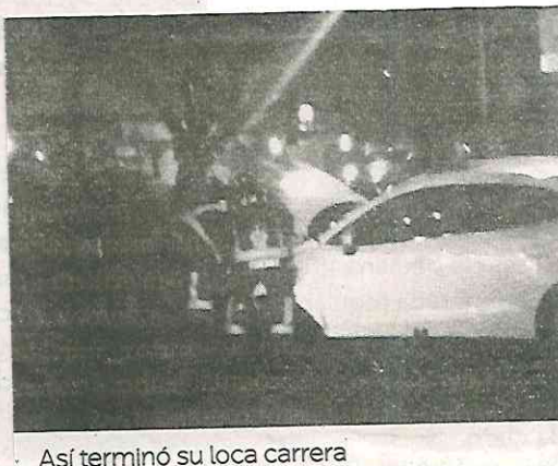
Así terminó su loca carrera

En esta época de diciembre los accidentes han aumentado considerablemente