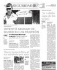
Falleció al instante