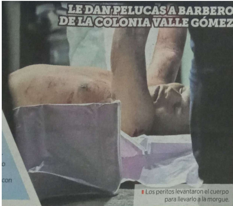
Los peritos levantaron el cuerpo para llevarlo a la morgue.