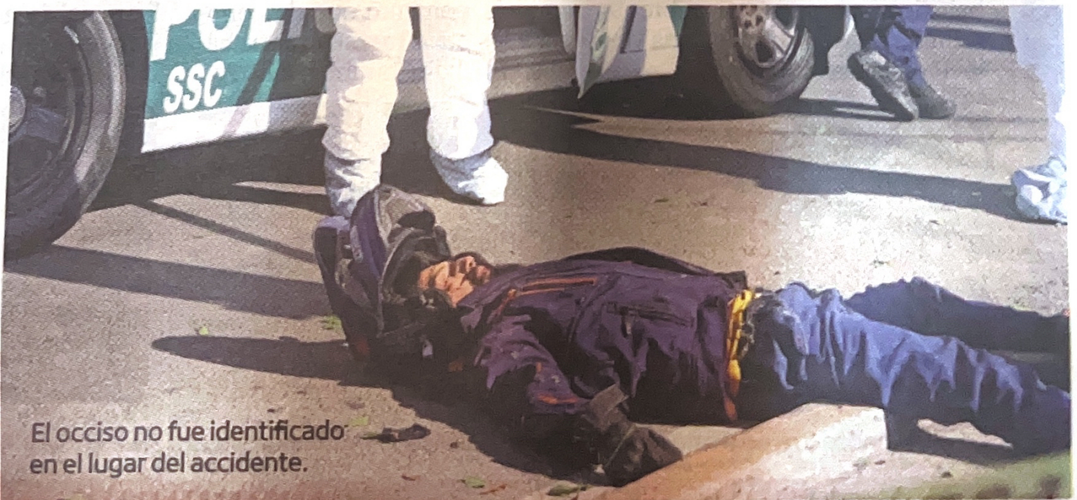
El occiso no fue identificado en el lugar del accidente.

Los testigos comentaron que antes de la llegada del personal de la Fiscalía, un grupo de uniformados retiró la moto del lugar; los peritos trasladaron el cadáver del motorista sin que fuera identificado, por lo que se espera que su familia lo reclame en la morgue.