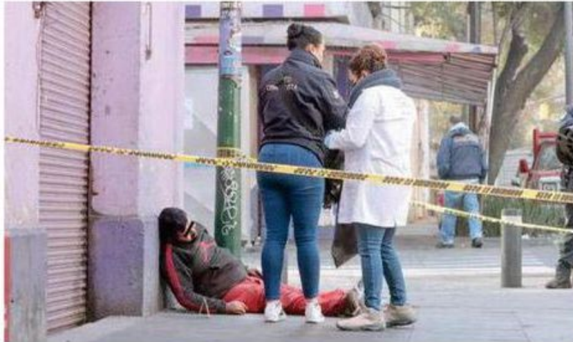
Un hombre aparece sin vida entre las calles de Zarco y Violeta; las autoridades capitalinas ya investigan

Los paramédicos dejaron el cadáver en el lugar, ya ante la presencia de los uniformados de la Secretaría de Seguridad Ciudadana (SSC), acordonaron el perímetro, hasta la llegada del personal del Ministerio Público.