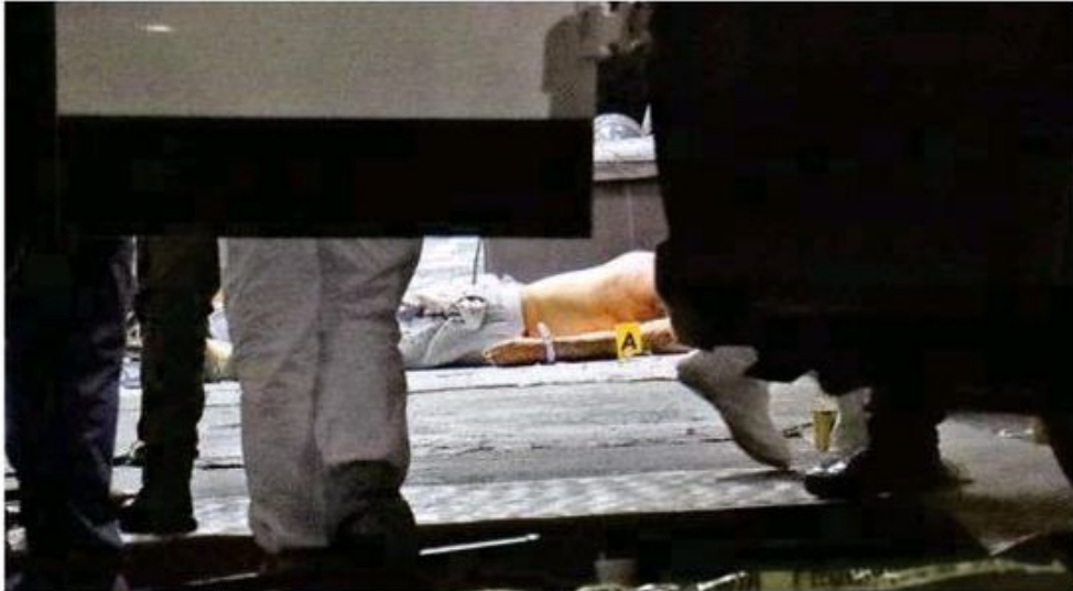
"Era la borrega", dijo un hombre que se encontraba entre los curiosos