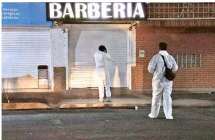
Los asesinos de forma directa entraron al negocio y mataron al hombre