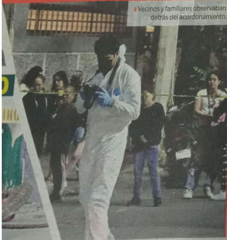
Vecinos y familiares observaban detrás del acordonamiento.