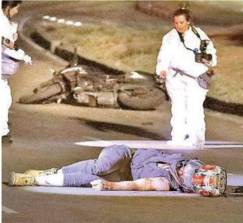
Luis "N" , de 27 años de edad, quedó muerto justo al entrar a una curva ubicada a la altura del Panteón Francés