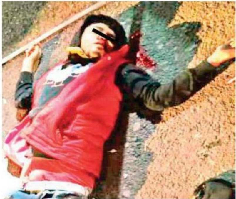
Este nuevo hecho de violencia ocurrió la noche del pasado jueves en la calle de Jesús Carranza

Mientras que el baleado se debate entre la vida y la muerte en un hospital, agentes de investigación del gabinete de seguridad del gobierno de la Ciudad de México continúan con las indagaciones a fin de localizar y detener a los criminales.