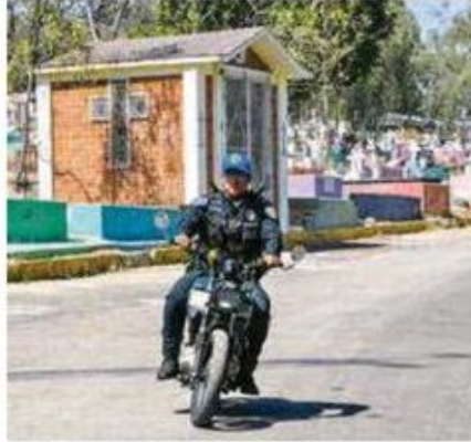
Policías vigilan el panteón Tolentino