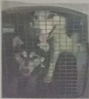
■ Los canes rescatados eran mantenidos en condiciones de maltrato.