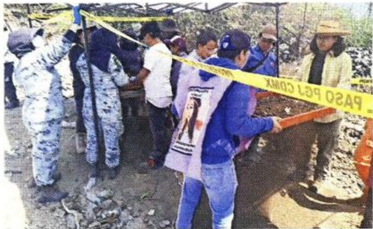
Personal de la fiscalía analiza los restos hallados ayer para identificarlos.

El 5 de noviembre del 2017, la joven de 23 años desapareció tras asistir, junto con cinco amigos, al concierto "Soul Tech", cerca de la Picacho-Ajusco. En mayo pasado, su familia realizó una jornada de búsqueda sin resultados y han acusado a la fiscalía de simulación.