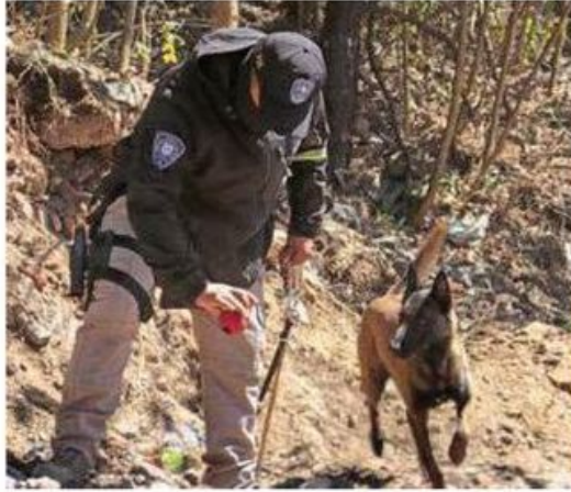
Binomios caninos participaron en los trabajos