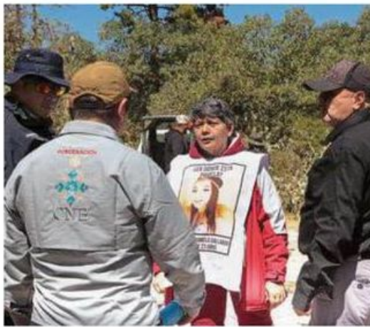
Las brigadas hallaron distintas prendas en el lugar