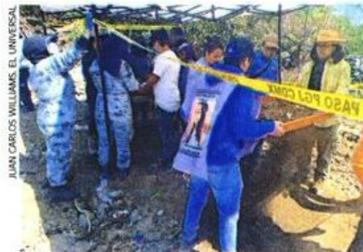
Autoridades cercaron la zona en la que encontraron los restos humanos.

18 DE AGOSTO DE 2018 colectivos encontraron un cráneo en el Valle de Tezontle, en el kilómetro 18.7.