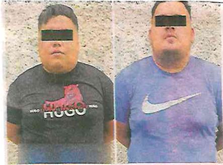
Estarían relacionados con trámites vehiculares, al parecer apócrifos, en el Estado de México