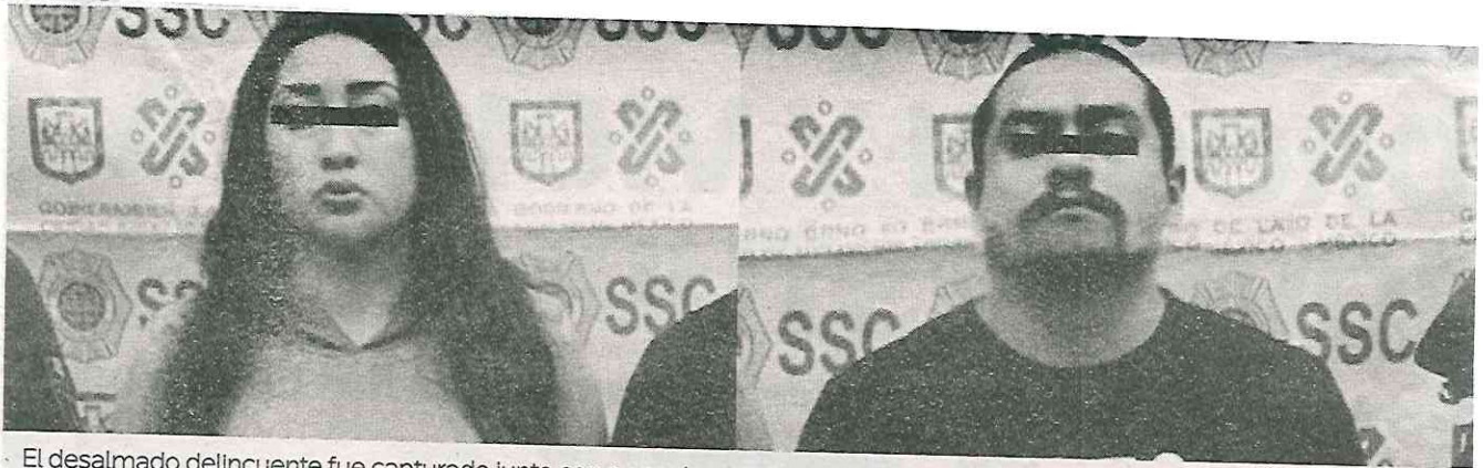
El desalmado delincuente fue capturado junto con su novia