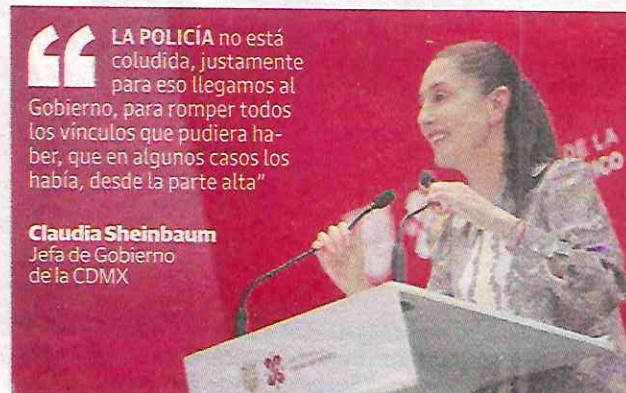
Claudia Sheinbaum Jefa de Gobierno de la CDMX

LA JEFA DE GOBIERNO señala que la Fiscalía deslindará responsabilidades sobre ejecución de dos jóvenes; destaca trabajo conjunto con la Guardia Nacional en zona del crimen