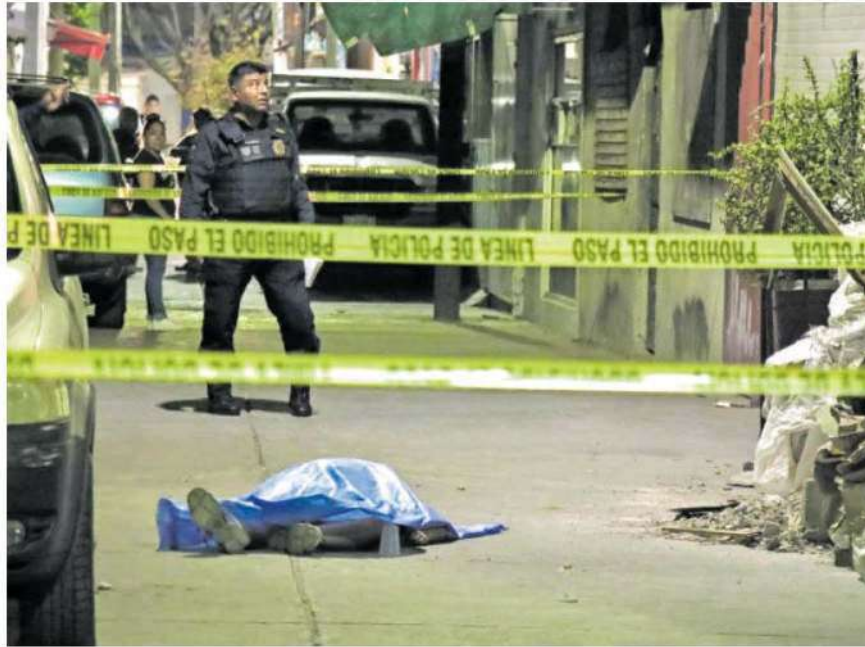
A quemarropa, en calles de la colonia Campamento 2 de Octubre