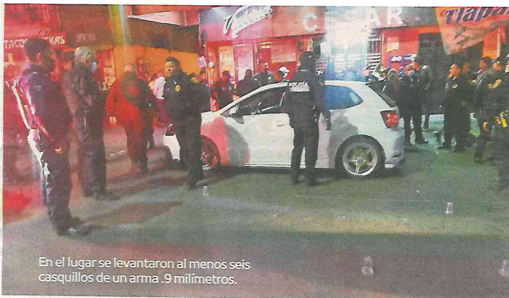
En el lugar se levantaron al menos seis casquillos de un arma .9 milímetros.