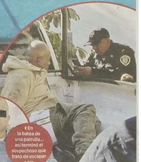
En la batea de una patrulla... así terminó el sospechoso que trató de escapar a pie.