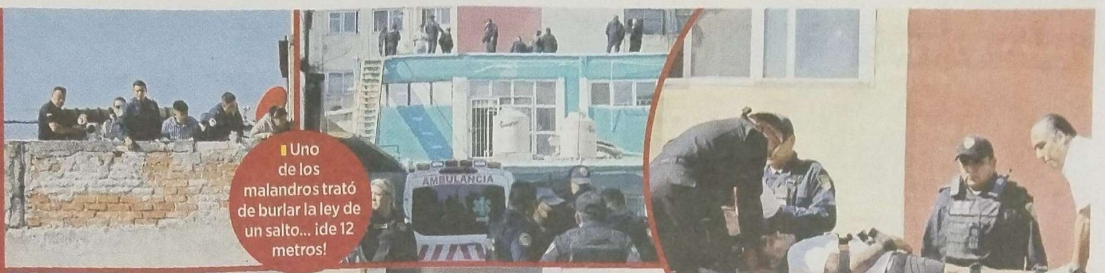
Uno de los malandros trató de burlar la ley de un salto... ¡de 12 metros!

El botín: celulares, aparatos electrónicos, una consola de videojuegos y una pistola con un cartucho útil, fueron presentados ante el MP.