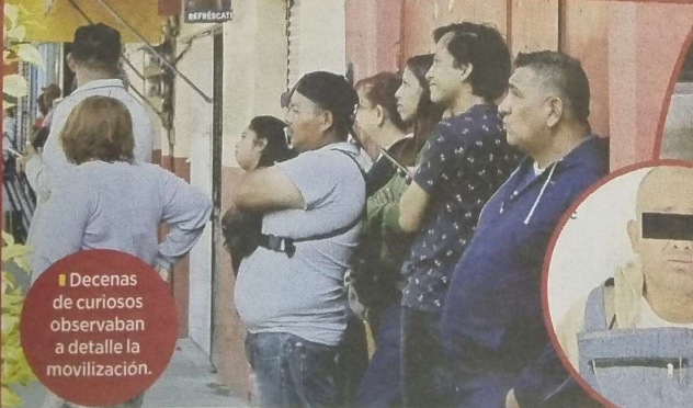
Decenas de curiosos observaban a detalle la movilización.