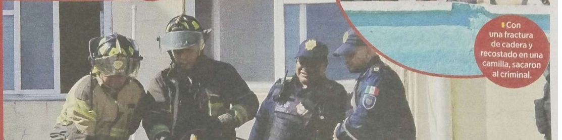
Con una fractura de cadera y recostado en una camilla, sacaron al criminal.