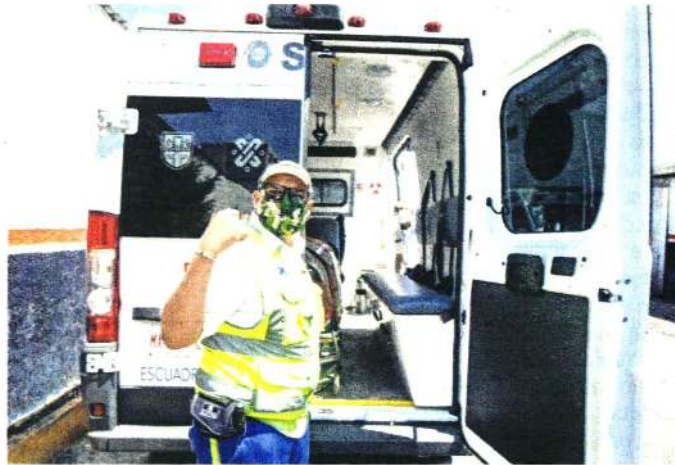
Con la app se coordinan el ERUM, el Centro Regulator de Urgencias Médicas y la Cruz Roja. Se le conoce como “el Uber de ambulancias”.