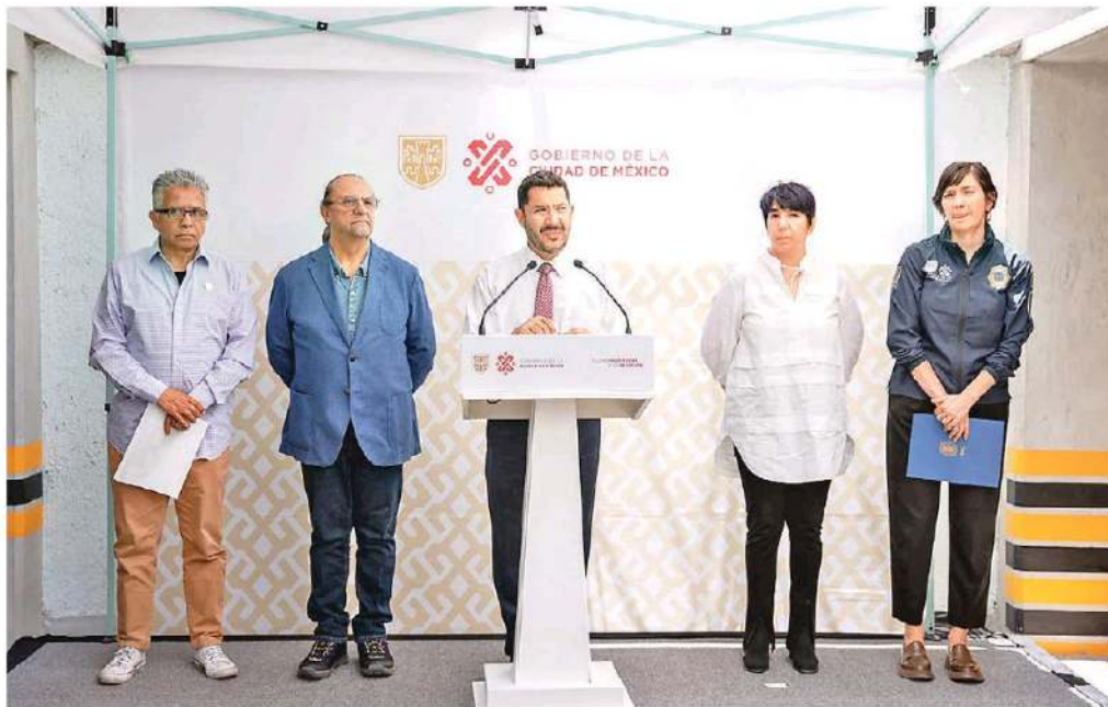
En conferencia de prensa, el jefe de Gobierno de la CdMx informó que el operativo será apoyado con 90 vehículos, 22 motopatruillas y cinco grúas