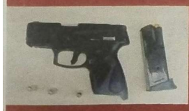
El botín y un arma de fuego fueron presentados ante el MP.