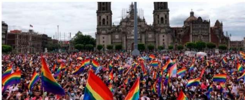
El personal supervisará el desarrollo de la marcha.