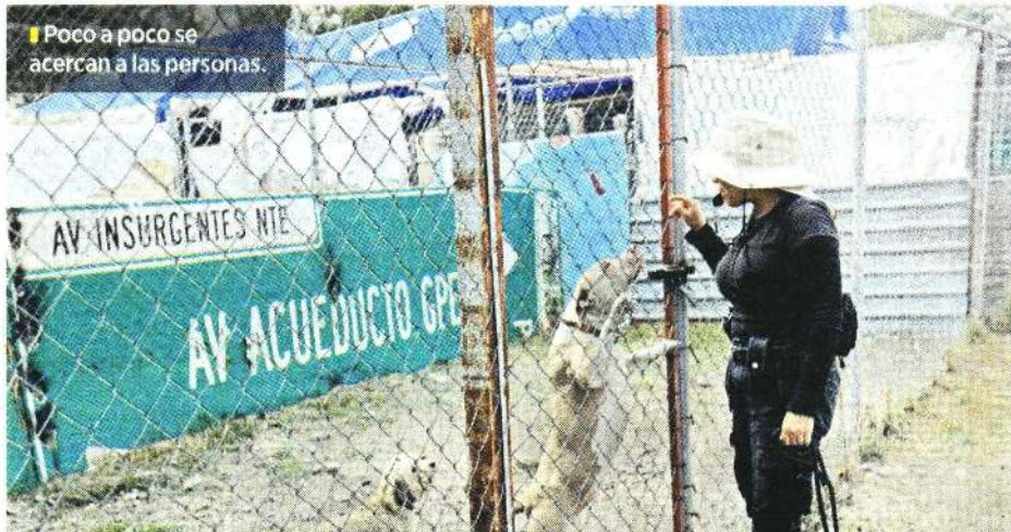
Poco a poco se acercan a las personas.