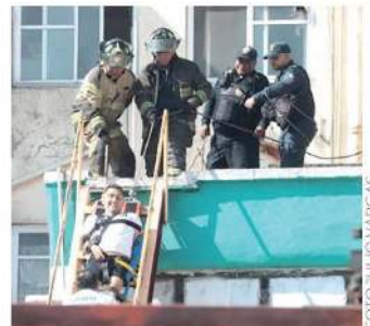
Uno de los ladrones herido

Los delincuentes lesionados fueron llevados a un hospital bajo custodia policial, mientras su cómplice fue trasladado al Ministerio Público