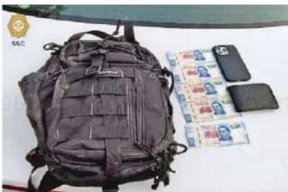
Lo asegurado fue puesto a disposición del agente del Ministerio Público