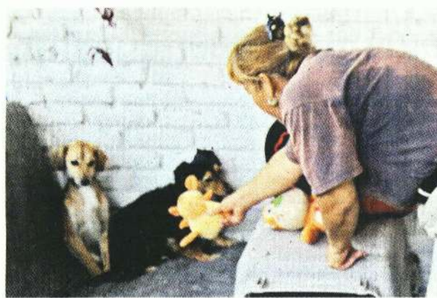
■ "Berna" y "Cari" fueron parte de los nueve canes rescatados en un inmueble en la Alcaldía Miguel Hidalgo.