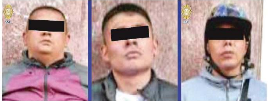
Los hombres, de 28, 31 y 33 años de edad, fueron arrestados e informados de sus derechos de ley

Por estos hechos, los hombres de 28, 31, y 33 años de edad fueron detenidos, informados de sus derechos de ley y junto con la motocicleta y lo asegurado, fueron puestos a disposición del agente del Ministerio Público correspondiente, quien determinará su situación jurídica.