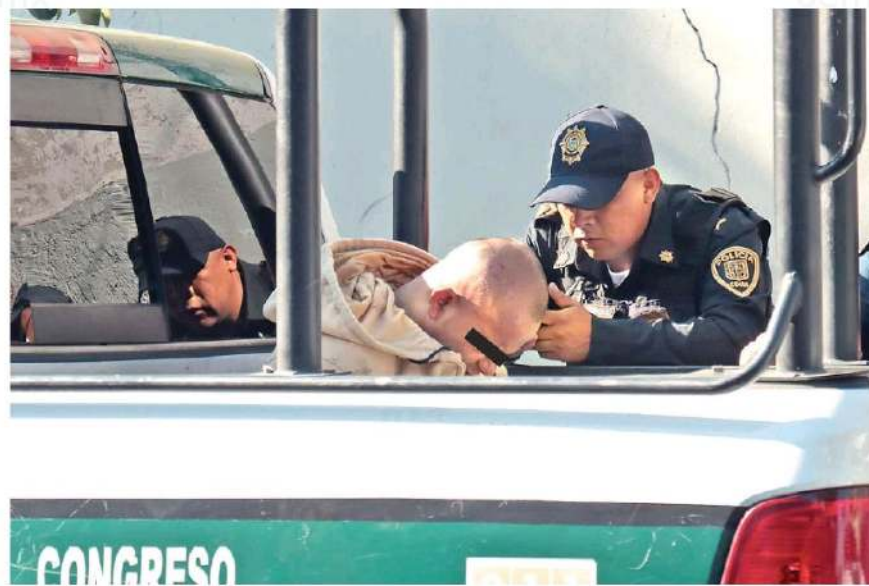
Los presuntos ladrones ingresaron a un domicilio y sustrajeron objetos de valor en la zona de La Merced, colonia Centro