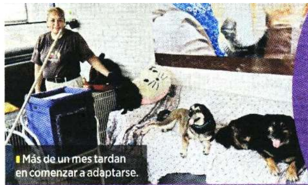
■ Más de un mes tardan en comenzar a adaptarse.