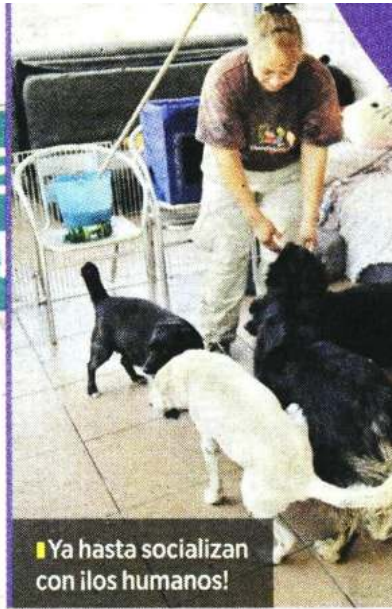
Ya hasta socializan con ilos humanos!