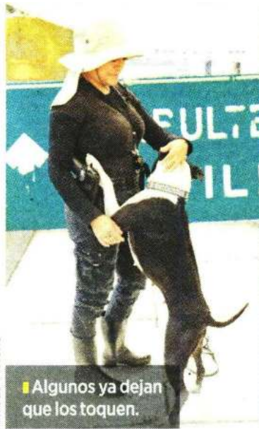
Algunos ya dejan que los toquen.