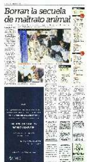
SANAR LAS HERIDAS. Entre los canes que resguarda la Brigada hay algunos que fueron abandonados.