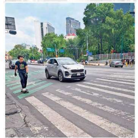
INCIDENTE. La SSC revela que el mayor número decesos, por accidentes de tránsito en los últimos cuatro años, fueron por atropellamientos.

En tanto, la Dirección General de Calidad del Aire de la Secretaría del Medio Ambiente (Sedema), estima que a diario circulan en la Zona Metropolitana del Valle de México 4.8 millones de vehículos, de un parque vehicular de 5.8 millones de automotores.