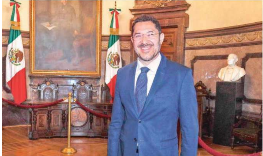
Martí Batres , jefe de gobierno capitalino habló sobre las prioridades