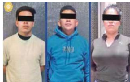
Los tres detenidos cuentan con antecedentes delictivos

puestos a disposición del agente del Ministerio Público correspondiente, quien determinará su situación jurídica. Cabe hacer mención que, tras realizar un cruce de información, se supo que el detenido de 28 años cuenta con un ingreso al Sistema Penitenciario de la Ciudad de México en el presente año por Delitos contra la salud.