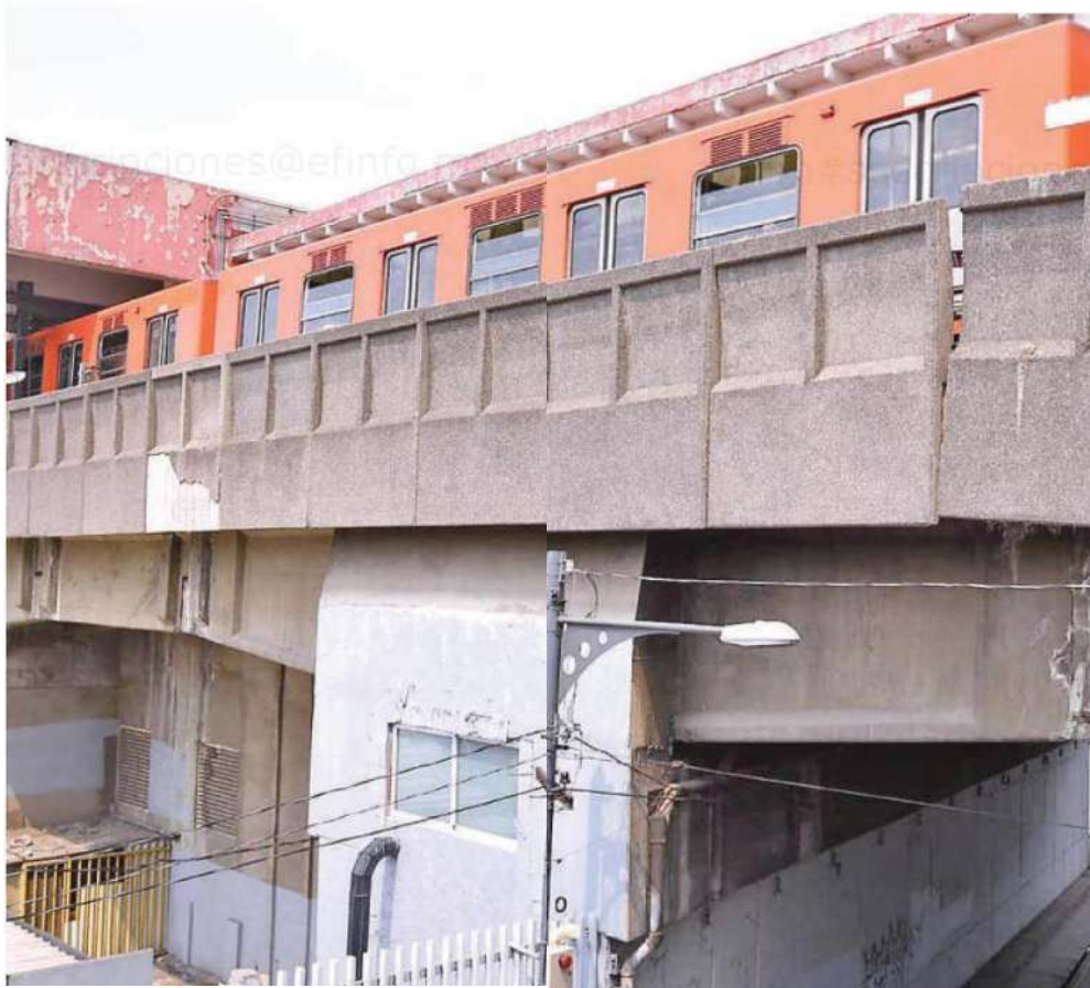
Las Líneas 3 y 9 del Metro serán objeto de una rehabilitación