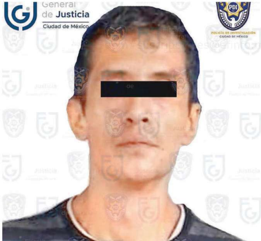
La autoridad judicial fijó un mes de plazo para el cierre de la investigación complementaria

Édgar "N" y otras personas se acercaron al lugar donde se encontraba el denunciante y el animal; uno de ellos le propició una patada al canino y posteriormente al hombre