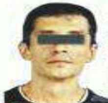
Edgar "N" fue vinculado a proceso.

Las investigaciones señalan que el individuo probablemente accionó en diversas ocasiones un arma de fuego contra un canino que se encontraba en la Colonia San Simón Toluahuac.