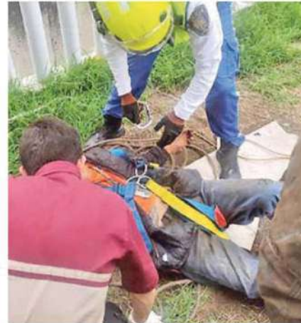
Paramédicos del ERUM lo diagnosticaron como policontundido

El adulto mayor fue atendido por paramédicos del ERUM, quienes lo diagnosticaron como policontundido con heridas dermoabrasivas en brazos y abdomen, además sufrió quemaduras por fricción en la espalda, sin requerir traslado a un hospital.