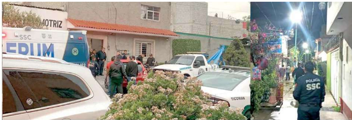
En un taller de grúas y un andador mataron a tres