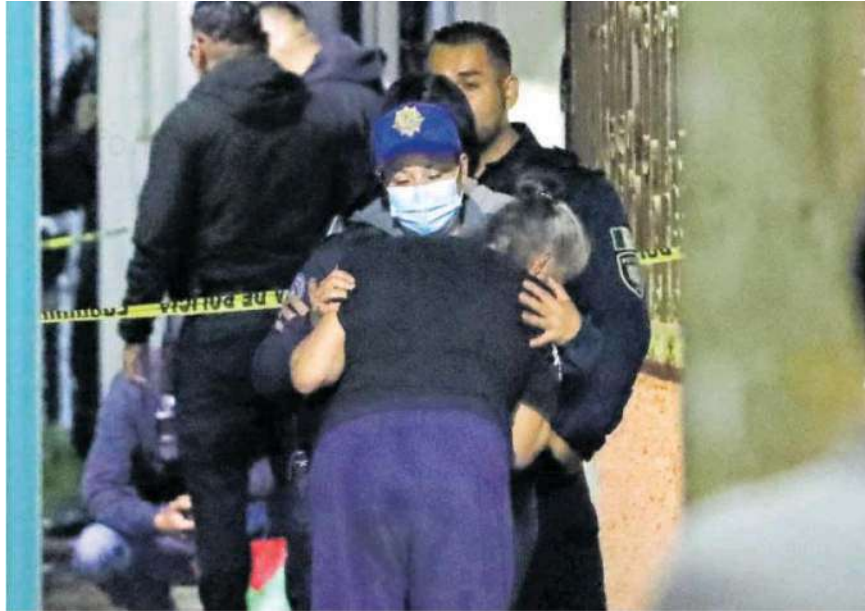
Autoridades procedieron a entrevistar a familiares de las víctimas, entre estos se encontraba la madre de uno de los occisos