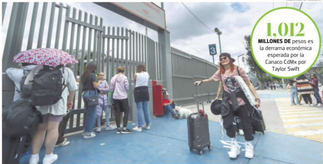
Hoteles cercanos al Foro Sol reportan que no tienen disponibilidad de habitaciones

"Es un evento único, sólo va a tocar en tres países de América Latina, y esto trae gente de todo el mundo, de América, Centroamérica y Estados Unidos", comentó.