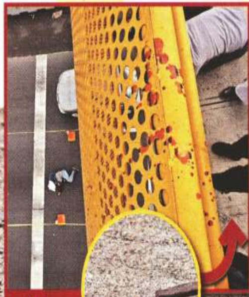
PUÑAL En el puente había un arma y sangre.

metro CIUDAD DE MÉXICO LECTURA DE LA GRAN CIUDAD