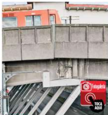
ANUNCIAN. En el STC adelantaron que una vez entregada la Nueva Línea 1, iniciarán las obras de compostura en Pantitlán.