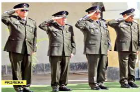
PRIMERA CEREMONIA EN PEROTE, VERACRUZ

El hundimiento del inmueble provocó una fisura de 65 centímetros de largo por 3 milímetros de ancho; será reparada a partir de septiembre. / 30