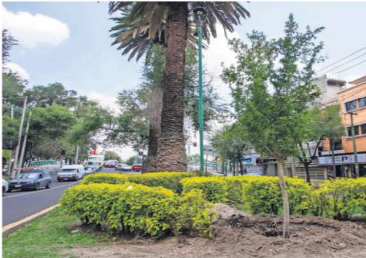
IMAGEN DEL DÍA PLANTAN 150 ÁRBOLES EN BJ

Como parte del proyecto de sustitución de palmeras que se realiza en la alcaldía Benito Juárez, se plantaron 150 árboles de especies nativas e introducidas en la avenida Doctor José María Vértiz, en el tramo que comprende del Viaducto Miguel Alemán Valdés a la avenida División del Norte. Se trata de ejemplares de ébanos, astronómicas, olmos, duraznillos y magnolias, de cuatro a seis metros de altura.