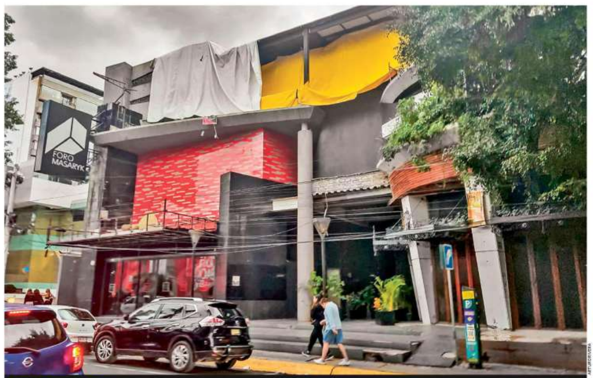
OBRAS IRREGULARES. Edificaciones de antros ilegales, con el aval de la alcaldía Miguel Hidalgo, se suman a los problemas de inseguridad que viven y denuncian colonos de Polanco, quienes añaden que los permisos de uso de suelo anómalos incentivan la proliferación de esos giros CDMX P. 7