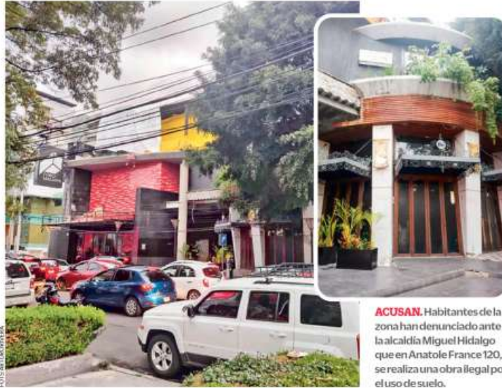
ACUSAN. Habitantes de la zona han denunciado ante la alcaldía Miguel Hidalgo que en Anatole France 120, se realiza una obra ilegal por el uso de suelo.

“Suspenden al República, pero simultánea-