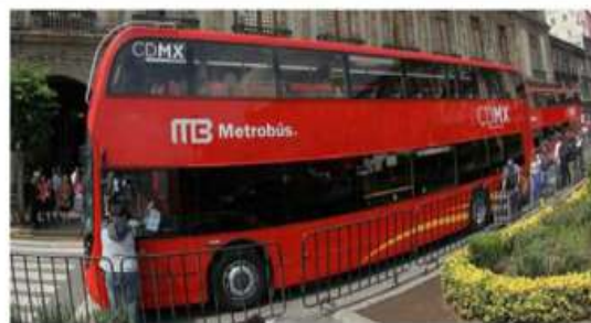
Durante este trayecto se atravesarán 16 estaciones pertenecientes a la Línea 7.

En este sentido, el Metrobús hizo un llamado a los usuarios