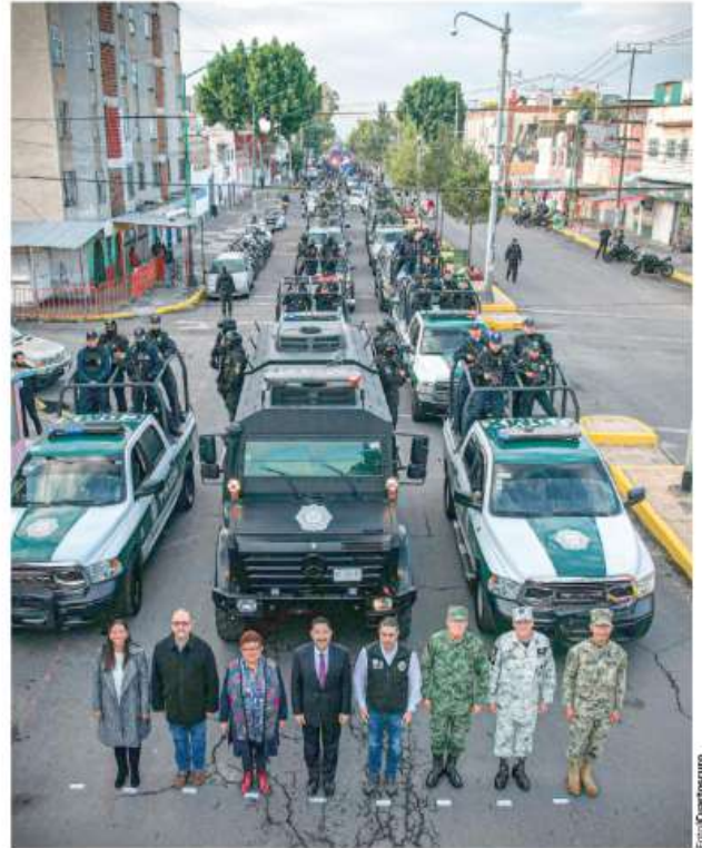
EL OPERATIVO arrancó ayer por la mañana en calles de la colonia Morelos.

La funcionaria destacó que en días pasados, personal de la Fiscalía detuvo a un hombre en la colonia Jardín Balbuena, por un feminicidio cuya víctima fue hallada en un inmueble de Coyoacán.