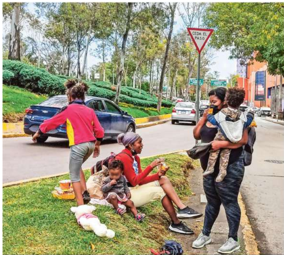
DIFÍCIL. CAMINO AL NORTE. Una familia de hondureños pide ayuda para alimento en CDMX. Desalentados por el freno migratorio a EU, esperan por meses legalizar su estancia para quedarse en el país MÉXICO Y MUNDO P. 4 Y 11