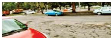
El arroyo vehicular de la avenida Estadio Azteca estaba visiblemente en mal estado el 31 de agosto pasado.