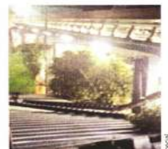
Durante un ensayo, ayer se desprendió una cadena en el elevador inclinado.

"Sobre el horario de funcionamiento, existe una controversia entre los propios vecinos, por lo que se armarán mesas de trabajo con la Dirección General de Participación Ciudadana para llegar a un acuerdo", explicó la Alcaldía.