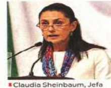
Claudia Sheinbaum, Jefa de Gobierno de la CDMX.