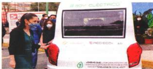
La jefa de Gobierno dio a conocer otros planes en materia de movilidad, como la posibilidad de transporte masivo en Milpa Alta.

Explicó que se trata de una obra con inversión del gobierno federal y de la entidad mexicana, mientras que la operación será del Gobierno capitalino, a través