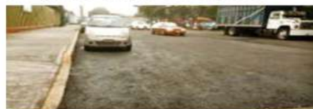
Para el 7 de septiembre ya se había reempavado, sin embargo, la licitación para estas obras apenas se iba a fallar el día 10.

El 10 de septiembre, siete días antes de la fecha en que estaba programado que iniciaran las obras, un fedatario público llevó a cabo una fe de hechos en la que dejó constancia de que trabajos de la licitación COY-DGO-DU-O-LP-27-2021 ya se habían concluido y otros estaban en proceso.