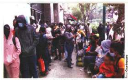
HAITIANOS, ayer en la colonia Juárez afuera de la Comar.

◦ Activistas ubican 4 rutas y ayuda de polleros para llegar al norte; renuncia enviado especial de EU a Haití