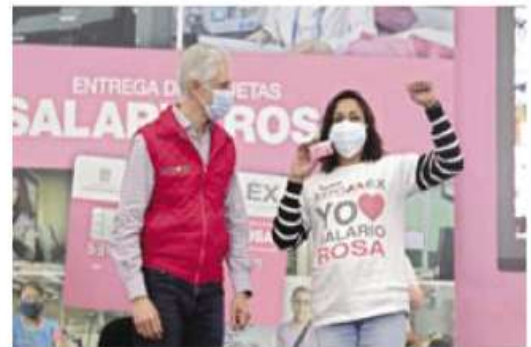
NEZAHUALCOYOTL, Edomex.- Alfredo Del Mazo. Aprendizaje para generar más ingresos.

Se calcula que hay 12 mil 930 casos activos en la capital del país, mientras que la tasa de incidencia es de 24.61.