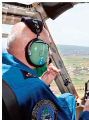
ESPECIALISTAS. Con técnicas de rapel, los rescatistas evacuaron a los pacientes en camillas y al personal médico en los brazos.

LLEVAN 675 OPERACIONES EN LO QUE VA DEL AÑO... Y CONTANDO