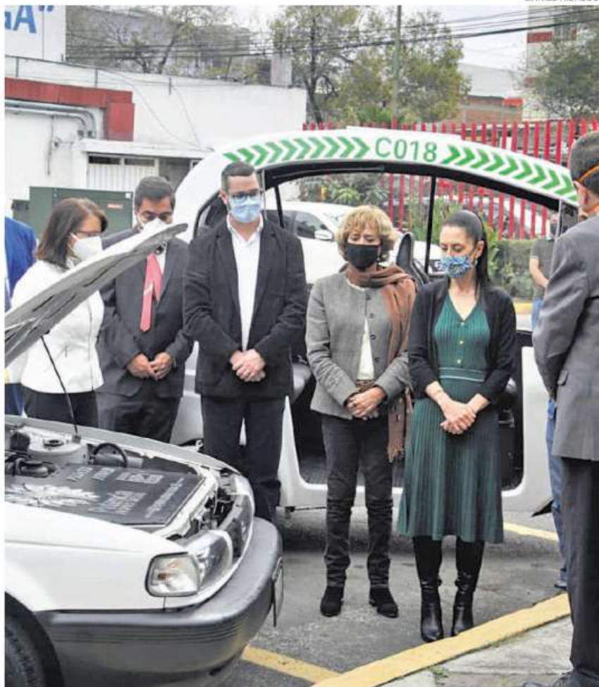
La industria desarrollará en este centro apps de monitoreo de transporte y servicios

El objetivo de la Ciudad de México es convertir al centro en un punto donde se vinculan academia, industria y gobierno