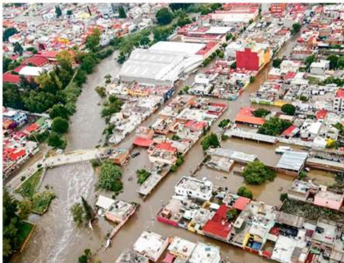
DEVASTACIÓN. Al llegar a Tula, Hidalgo, los Cóndores se encontraron con una ciudad arrasada por las aguas de dos ríos desbordados.

Con el tiempo en contra, los pilotos enfilaron de vuelta a la capital, donde policías