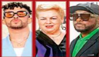
Bad Bunny, Paquita la del Barrio, Will.i.am, de Black Eyed Peas.

Con diez premios, Bad Bunny fue el máximo ganador en los Billboard de la Música Latina. Se hizo acompañar por Paquita la del Barrio, quien fue reconocida por su trayectoria. Black Eyed Peas, el otro gran triunfador.