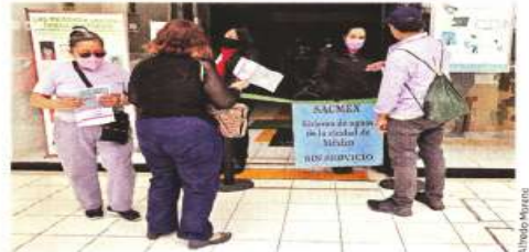
En la Alcaldía Iztapalapa las sucursales no pueden brindar el servicio de cobro a los usuarios.

En otras zonas la historia no es distinta. En Cuauhté-