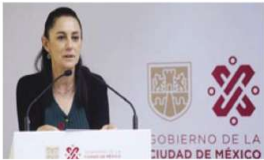
Claudia Sheinbaum. Respaldó que la Fiscalía realice la investigación respectiva.